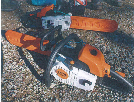
STIHL MS200 チェンソー