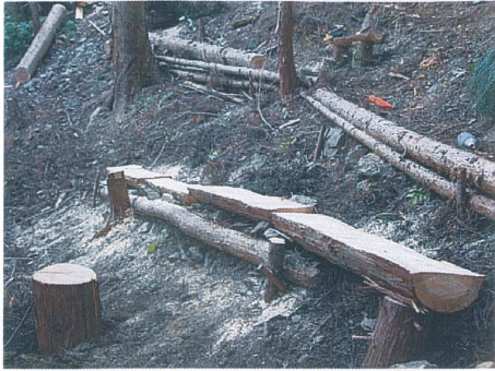
ベンチ作成 (昼食が食べ易くなります)