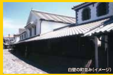
白壁の町並み(イメージ)

江戸時代の商都の面影「白壁の町並み」や、明治の文豪国木田独歩 ゆかりの史跡を残す歴史と文化のロマンあふれるまち、柳井。