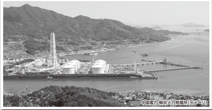
中国電力 柳井火力発電所(イメージ)