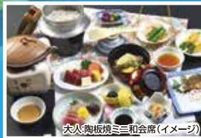
夫人・奥板焼三和会席(イメージ)