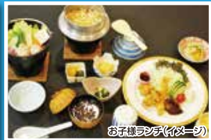
お子様メニュー(イメージ)

江戸時代の商都の面影「白壁の町並み」や、明治の文豪国木田独歩 ゆかりの史跡を残す歴史と文化のロマンあふれるまち、柳井。