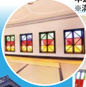
ステンドグラス(イメージ)

上関町 四階楼(しかいろう) 上関は古くから室津港や上関港を中心に海上交通の要衝として栄えて いて、その歴史をしのばせる文化財が四階楼。明治十二年に維新の志士 小方兼九郎が建てた、全国でも珍しい四階建ての擬洋風木造建築で、県 内最古のもの一つである。外観内装とも凝った造りが見られる国の重 要文化財(建造物)。最上階の四階は、窓にはステンドグラス、天井には鳳 凰の鏝絵(こてえ)がほどこされて圧巻。上関町郷土史学習館も付設さ れ、パネルや映像で上関の歴史が紹介されている。