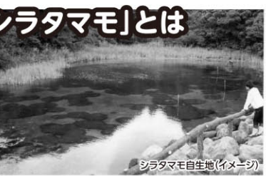
シラタマモ自生地(イメージ)

シラタマモの原産地としては、北アフリカのリビア、インド洋上のモーリシャス、太平洋上のニューカレドニアと、 日本では出羽島 で見ることができます。シラタマモの学術的価値としては、生物の進化を考えた場合、生物は海水中に起源をもち、海の中の進化から淡水へ、さらに陸上へと進化とともに移行したものと認められています。シラタマモは、海産生物から淡水生物ないし、陸上生物へと移行途中の形質を示すもので、かつて栄えたものがしだいに種として老化したもの、すなわち種として絶滅に近い状態「生きた化石」と考えられています。1億4千万年前に繁殖したシラタマモが日本では出羽島にのみ生息している 国指定天然記念物 です。めったにない機会なので、是非ご覧ください。