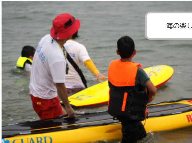
海の楽しさと厳しさを学ぶ