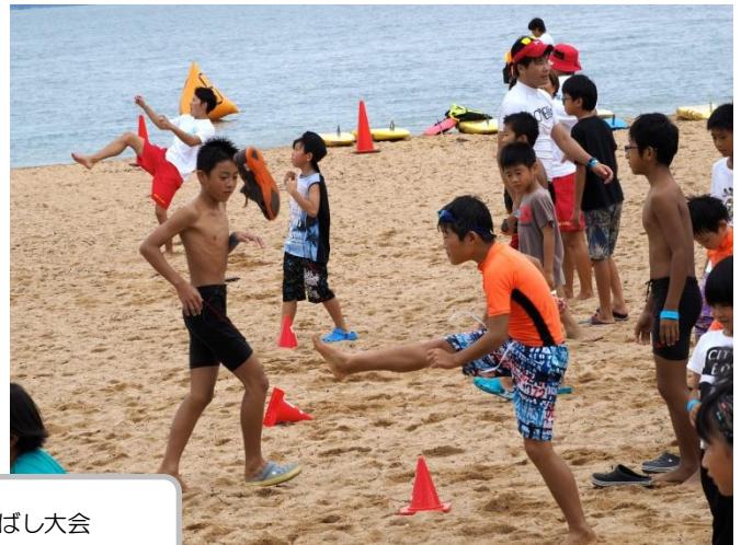
ビーサン飛ばし大会