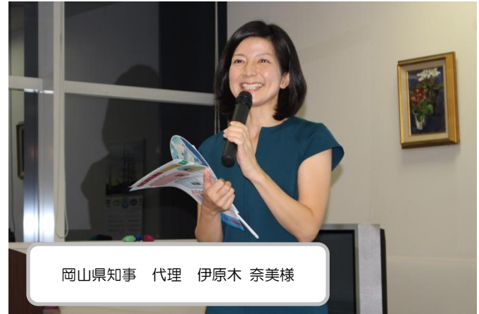
岡山県知事 代理 伊原木 奈美様