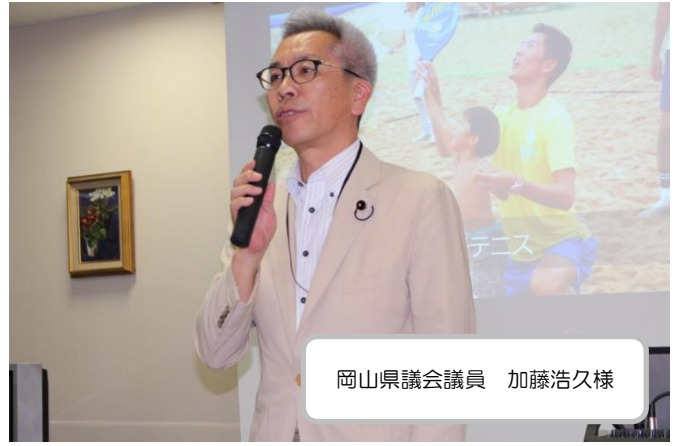
岡山県議会議員 加藤浩久様