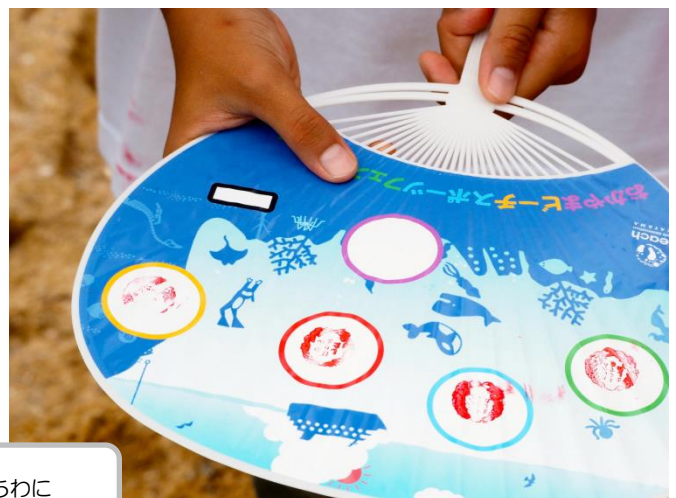
ごみにならないようにとスタンプラリーはうちわに