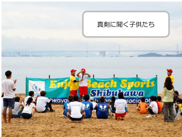
真剣に聞く子供たち