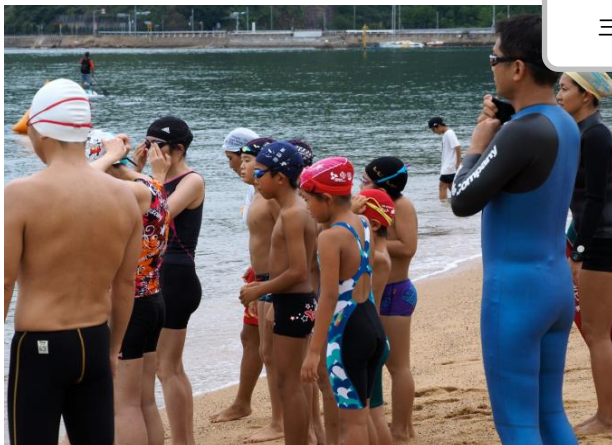
三村選手による水泳教室。参加者のタイムトライアルを行いました。