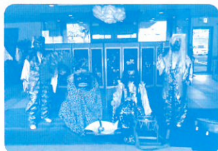
獅子舞、天狗舞と乱打