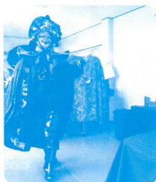
中国伝統芸能「変面」