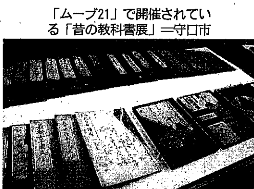
「ムーブ21」で開催されている「昔の教科書展」=守口市

◇川端康成文学館夏休み企画「川端康成って知ってる?」 8月28日まで (午前9時～午後5時) 茨木市の川端康成文学館 (阪急茨木市駅下車) で。川端康成の生涯や業績をわかりやすく紹介。「伊豆の踊子」のアニメ上映 (1日3回)、学芸員解説 (土・日曜)、プラ板工作 (水曜午後3時半) ほか。小中学生対象のクイズでは、正解者先着200人に、同館オリジナルファイルプレゼント。入場無料。休館日は火曜と祝日の翌日。問い合わせは同館 (☎072・6255・5978)。