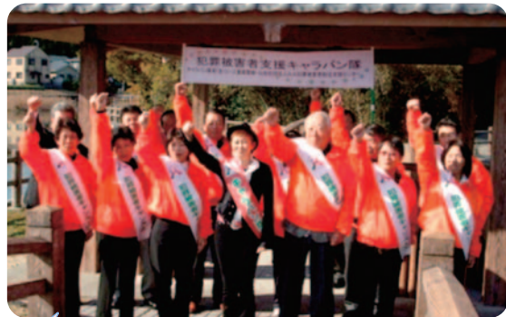
隊長のあつさんはじめキャラバン隊のメンバー