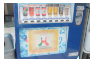
当センターのロゴマークがはいつています。

募金型自動販売機は、設置者様のみならず、清涼飲料水を購入される方々も気軽に社会貢献できるメリットがあります。もし、お近くで募金型自動販売機を見かけられましたらご利用をお願いします。