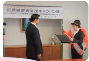
キャラバン隊実施状況