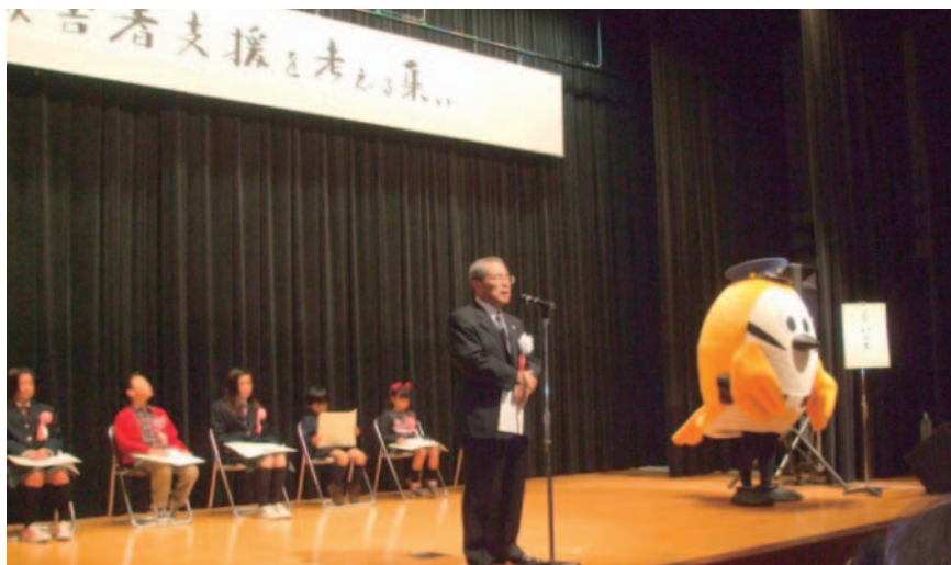
犯罪被害者支援を考える集い H21/12/6

公益社団法人みえ犯罪被害者総合支援センター／津市栄町1丁目891 合同ビル2F TEL059-213-8211 http://www.18.ocn.ne.jp/~mie-hhsc/