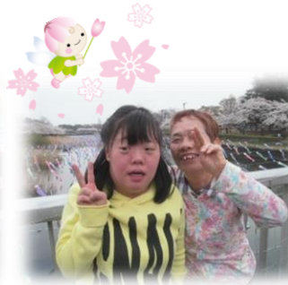
さくらを見に行こう