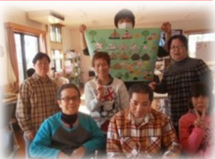
ひな祭りイベント