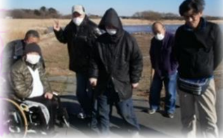
白鳥を見に行こう