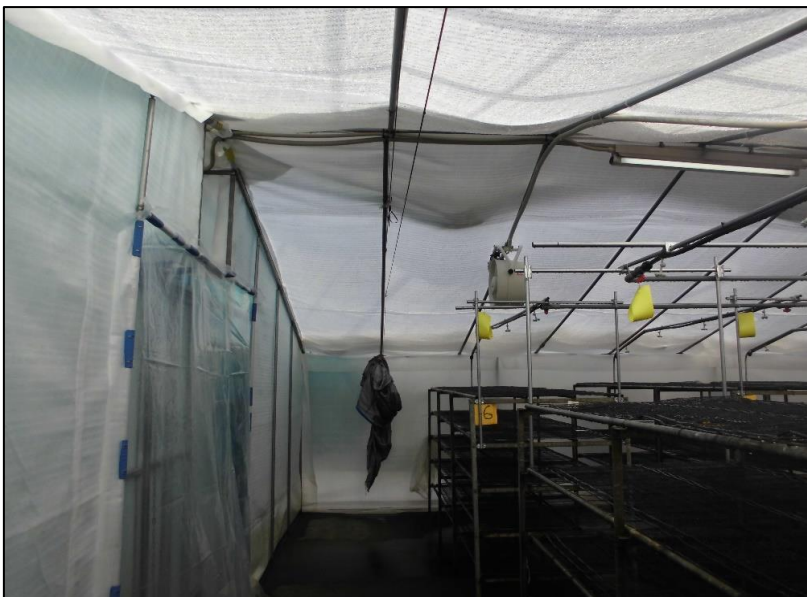
No.: 6 _____ 工種: 測点: A棟 内観