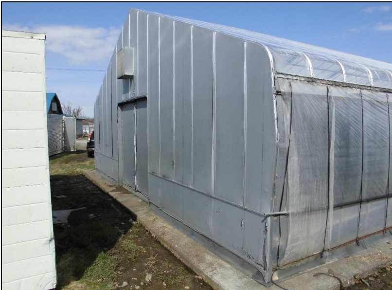
No.: 26 _____ 工種: _____ 測点: A棟 改修前