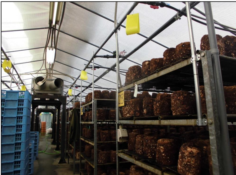
No.: 5 _____ 工種: 測点: A棟 内観