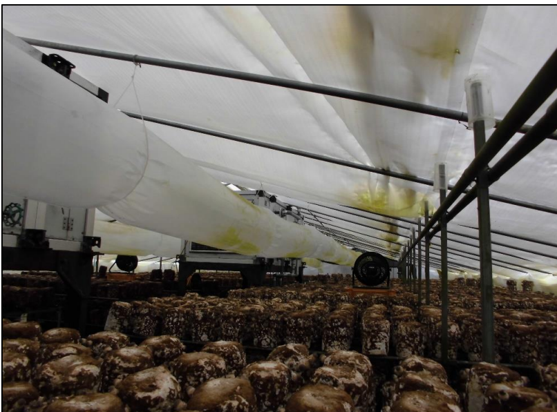
No.: 27 _____ 工種: _____ 測点: A棟 改修前