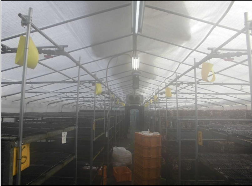
No.: 10 _____ 工種: 測点: A棟 内装