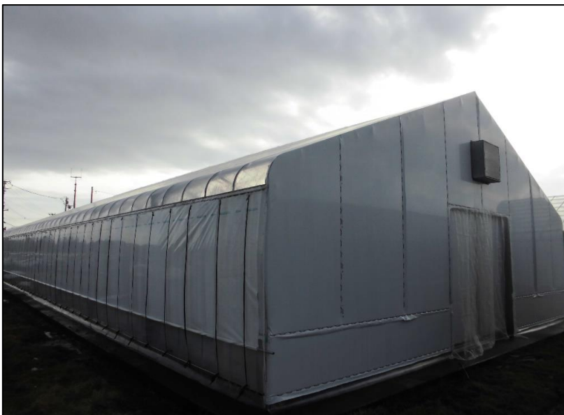
No.: 3 _____ 工種: 測点: A棟 外観