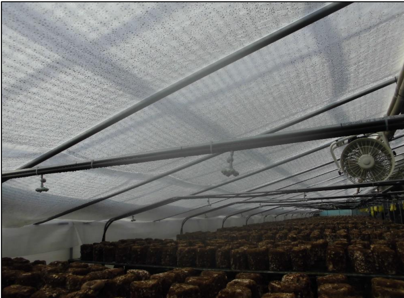
No.: 11 _____ 工種: 測点: A棟 内装