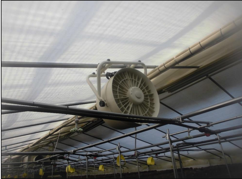
No.: 19 工種: 測点: A棟 循環扇