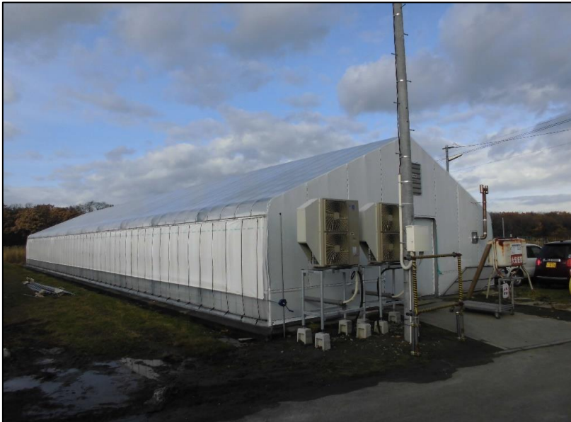
No.: 2 _____ 工種: 測点: A棟 外観