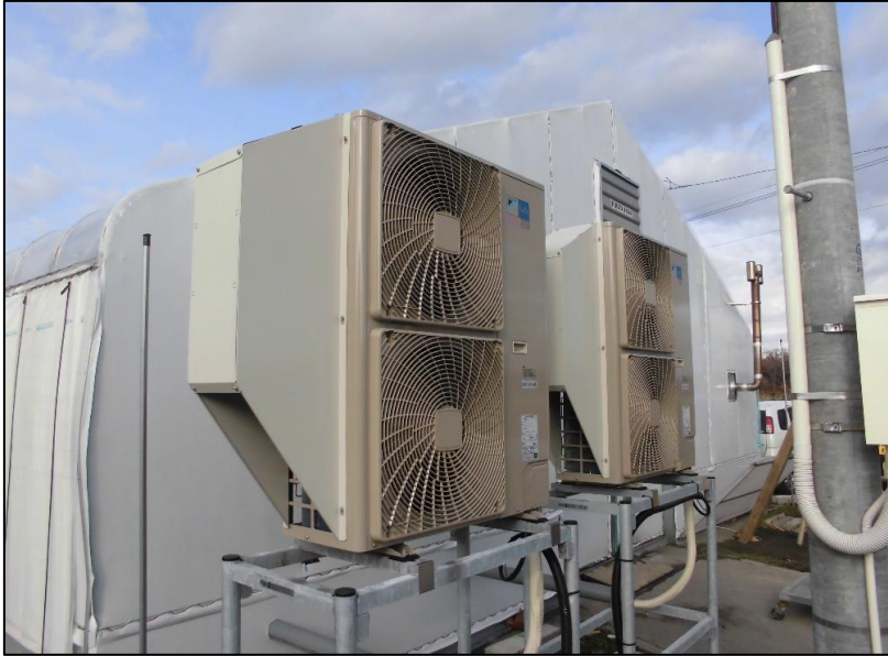
No.: 16 _____ 工種: 測点: A棟 冷房 室外機