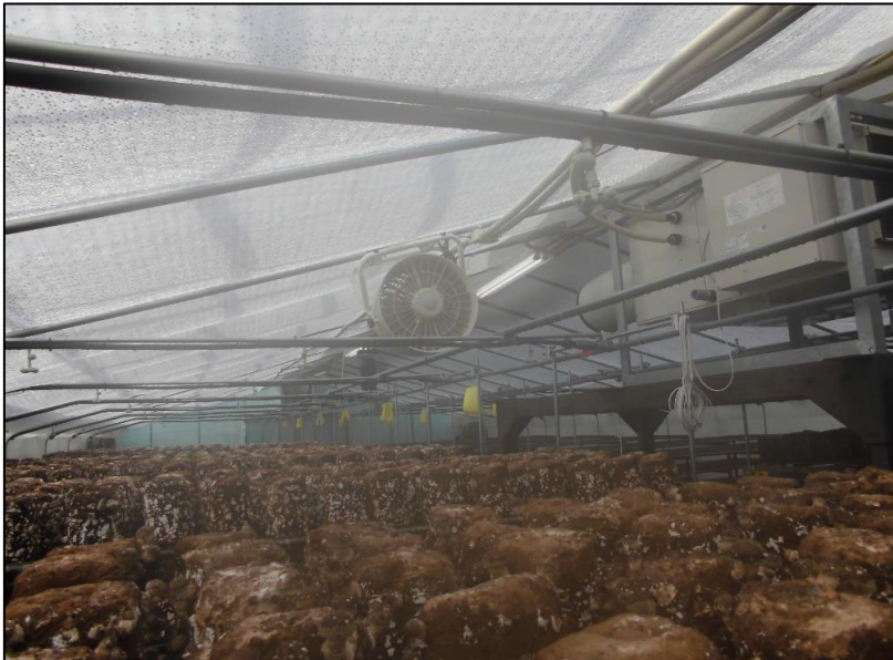
No.: 17 _____ 工種: 測点: A棟 冷房 室内機