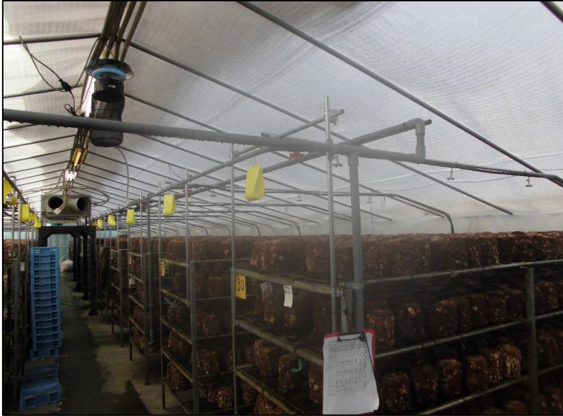
No.: 13 _____ 工種: 測点: A棟 灌水