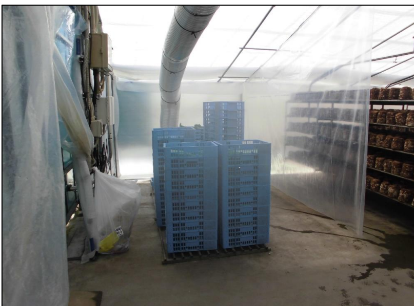
No.: 21 工種: 測点: A棟 ダクト