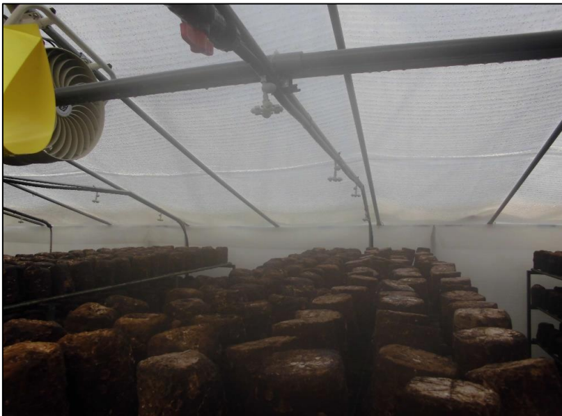
No.: 14 _____ 工種: 測点: A棟 灌水