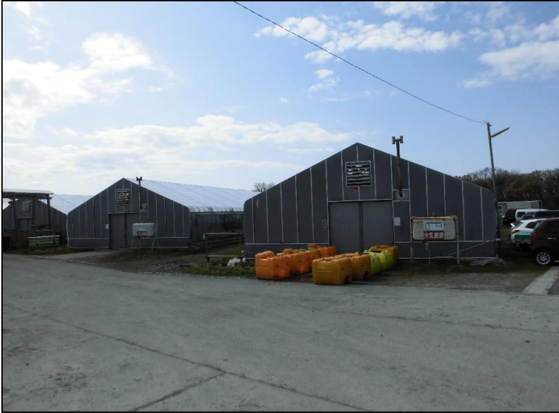
No.: 25 _____ 工種: _____ 測点: A棟 改修前