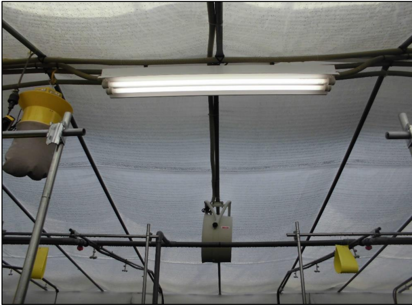
No.: 22 _____ 工種: 測点: A棟 照明