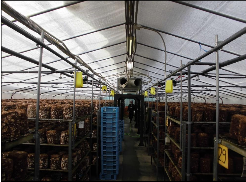
No.: 4 _____ 工種: 測点: A棟 内観