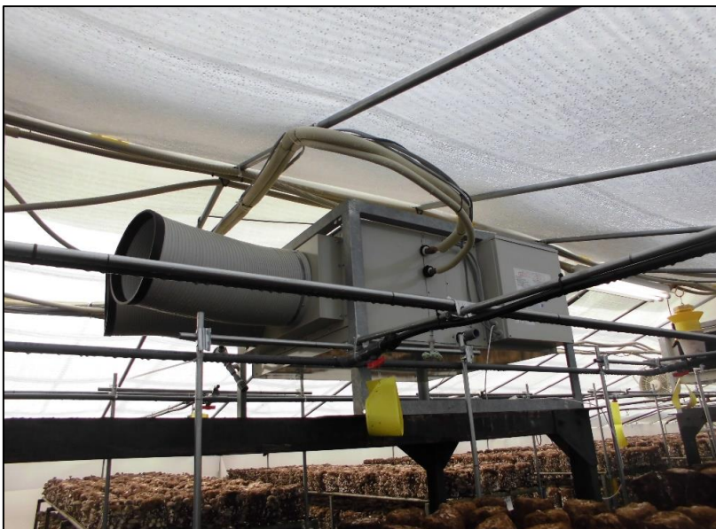
No.: 18 _____ 工種: 測点: A棟 冷房 室内機