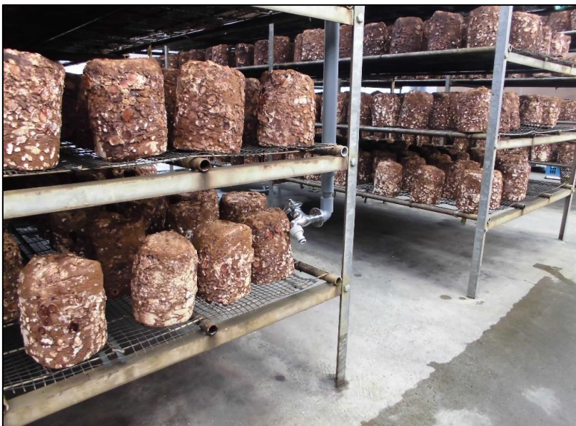
No.: 15 _____ 工種: 測点: A棟 灌水