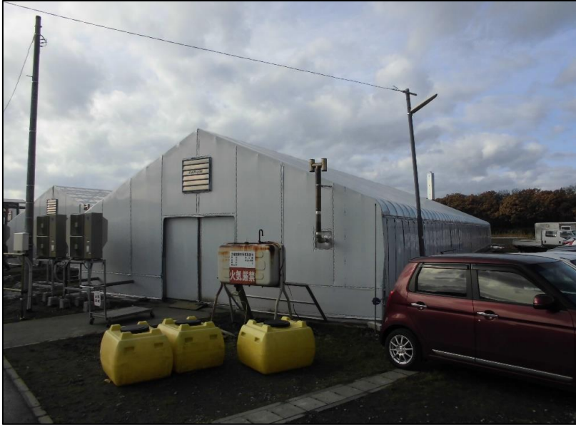
No.: 1 _____ 工種: 測点: A棟 外観