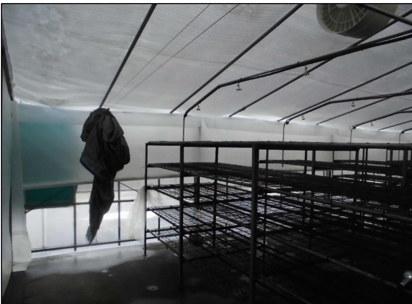
No.: 12 _____ 工種: 測点: A棟 内装