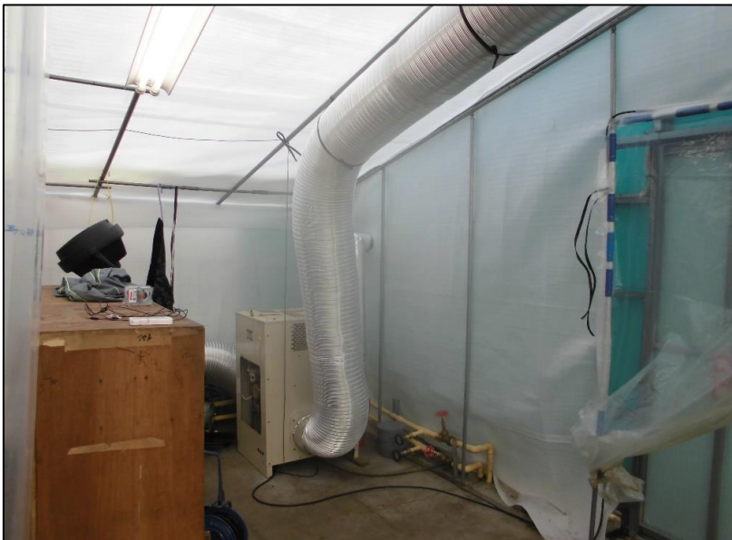
No.: 20 工種: 測点: A棟 温風ダクト