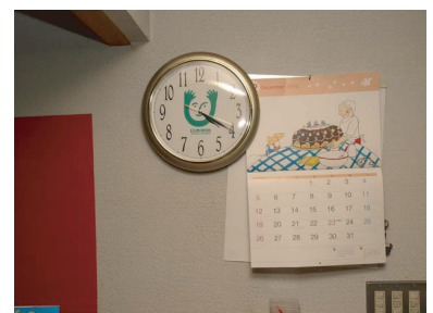
ご惠贈の時計。受付カウンターの上の壁面に