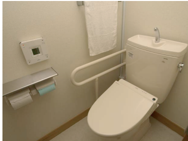
以前の女子トイレが男子用に