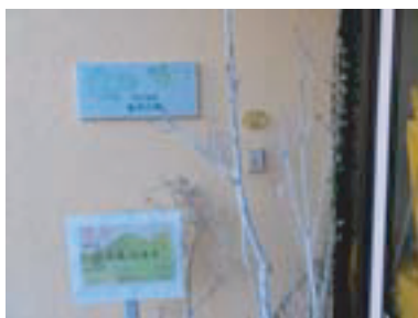
遠くから。右は玄関ドア