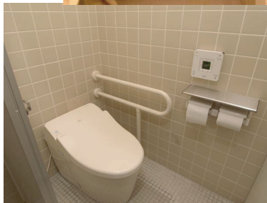
以前の男子トイレが女子用に

開いたドアに女子と幼児、車いすの表示。表面は、男子幼児&障害者用小便器と、女子用、大便器用を仕切るパーティション