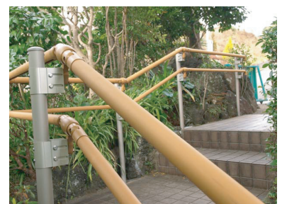
さらに次の踊り場から右に折れてまっすぐ続く