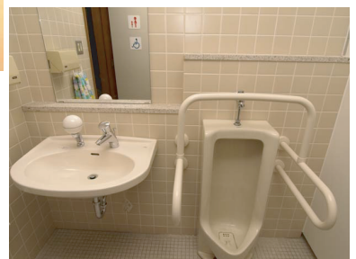
小便器は前のまま。幼児男子と障害者男子用に。女子トイレ室に併設

開いたドアに女子と幼児、車いすの表示。表面は、男子幼児&障害者用小便器と、女子用、大便器用を仕切るパーティション