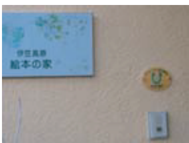
日本財団助成表示板はインターホンの上に固定