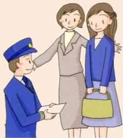
警察への付き添い

被害後、外出が難しい方には、必要に応じて自宅を訪問したり、警察、検察庁、裁判所、医療機関等への付き添い、関係機関との連絡等やマスコミ対応を行います。