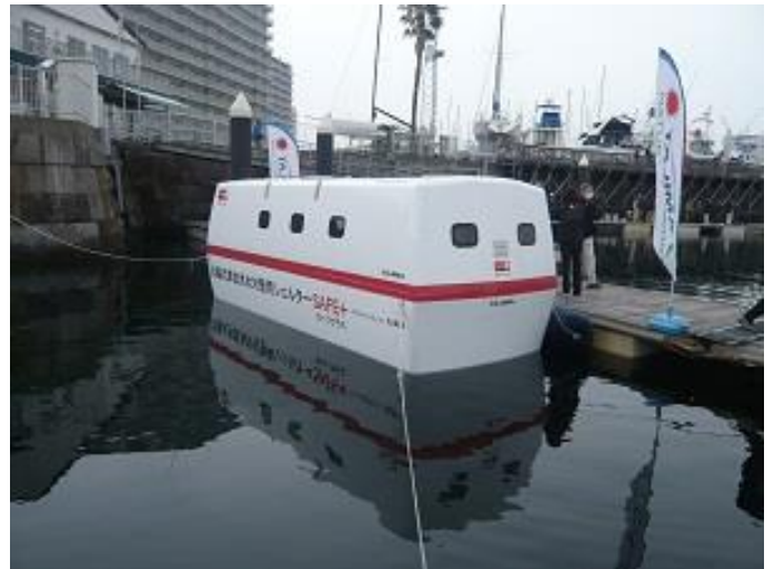
今回展示された[津波洪水対策用シェルター]