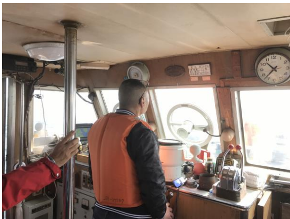
航海実技講習の様子（昼間）

・海技免状を取得して間がない方、航海経験がない方を対象に実習船を使用し講習を実施