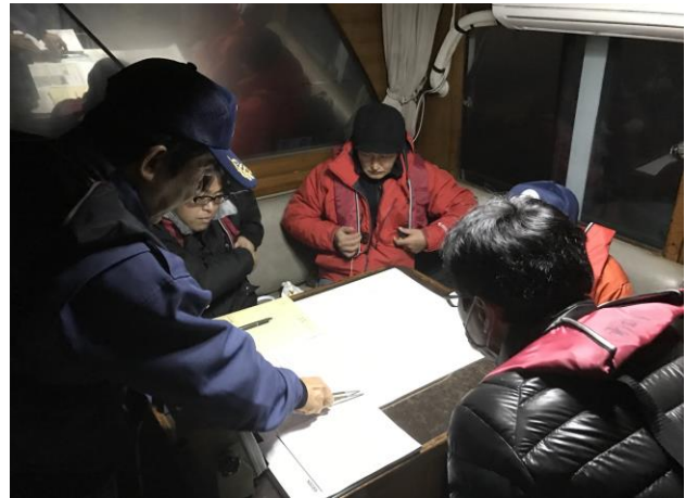
航海実技講習の様子（夜間）