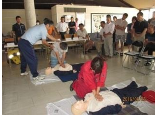
救命救急講習の様子