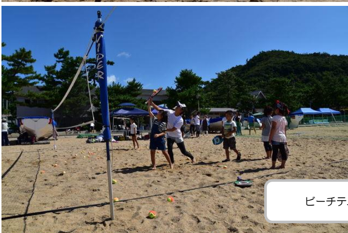
ビーチテニスは子どもたちに大人気でした。