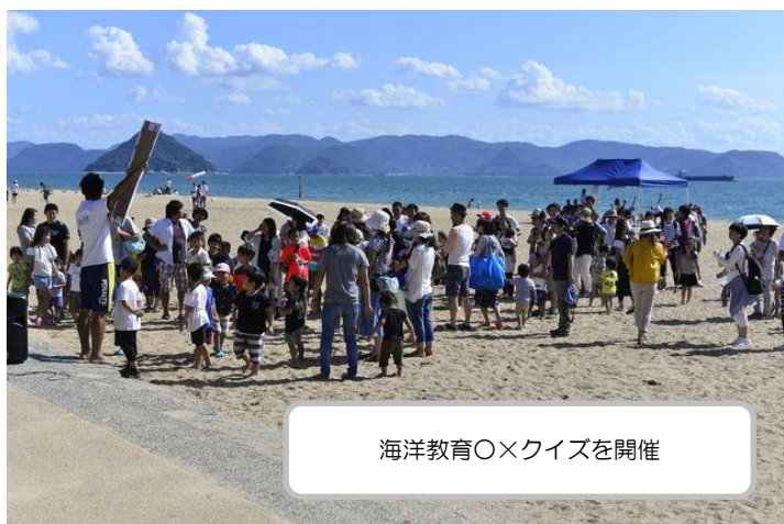
海洋教育〇×クイズを開催