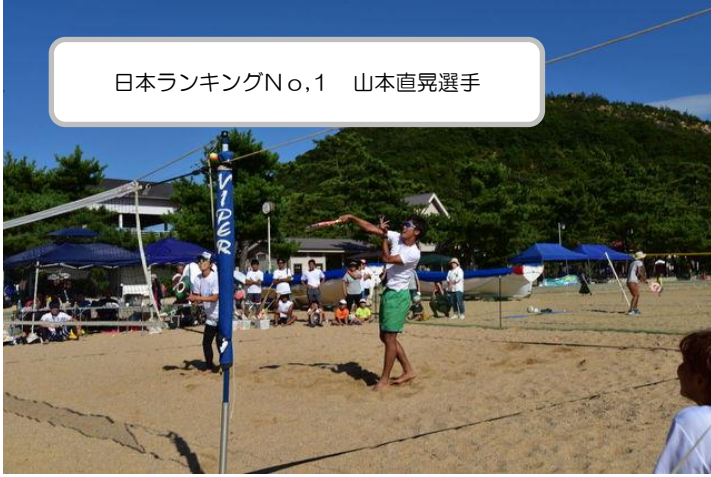
日本ランキングNo.1 山本直晃選手