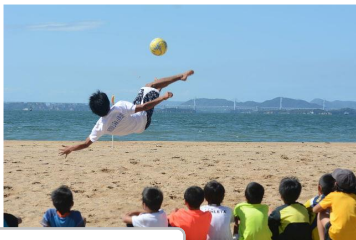
サッカー少年たちは、オーバーヘッドキックに釘付け！