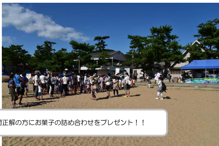
全問正解の方にお菓子の詰め合わせをプレゼント！！