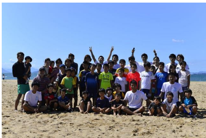
東京ヴェルディBSの選手たち