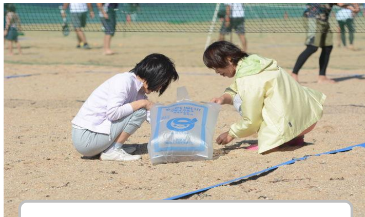
台風直撃により、たくさんのゴミが浜辺にあがりました。