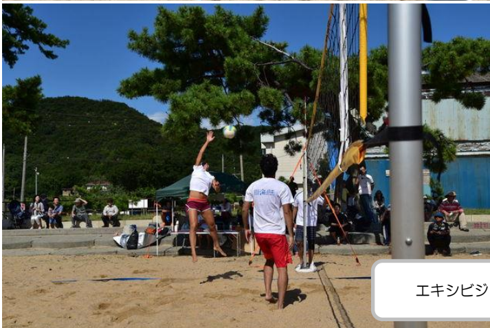
エキシビジョンマッチでスーパープレイを披露！！