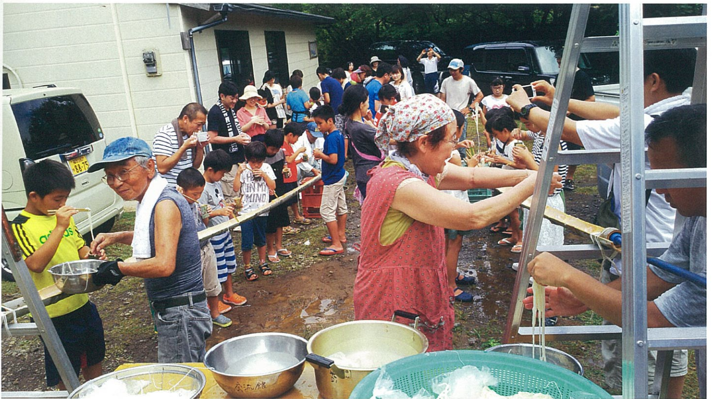
【根獅子賞】 流しうどん