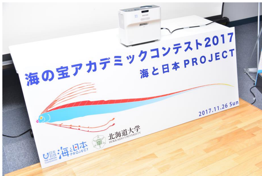
No. 6 パネル