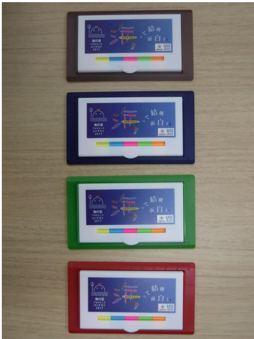
No. 12 オリジナル付箋