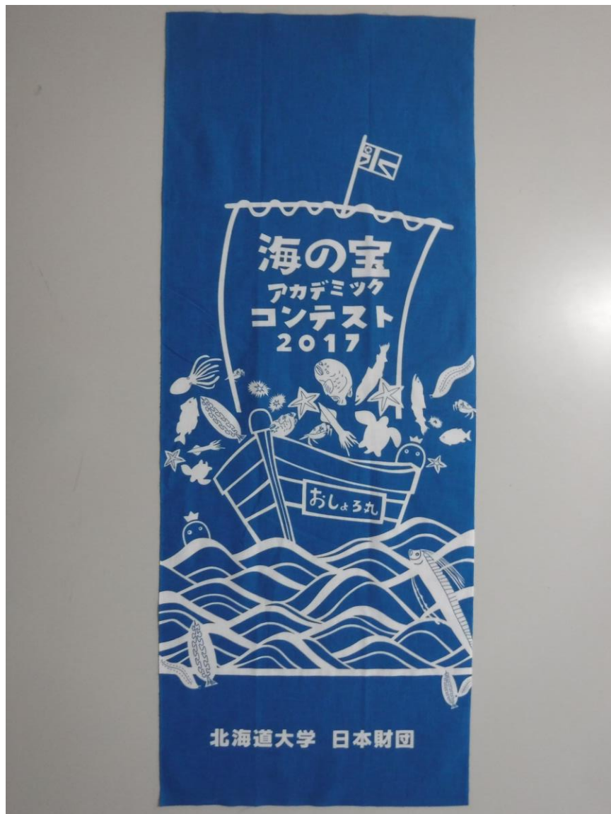
No. 14 メモリアルフラッグ