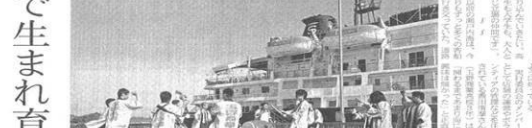
イベントの締めくくりに玉野市長の挨拶。玉野市長の挨拶。

ここで生まれ育ったこと少しでも誇りに 港のマルシェで活躍する若手世代の姿。ここで生まれ育ったこと少しでも誇りに。