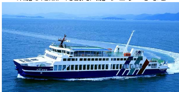
乗船した瀬戸内観光汽船 フェリーひなせ