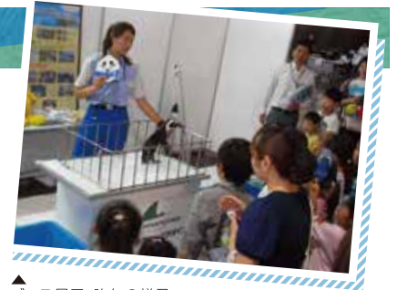
▲ブース展示、昨年の様子