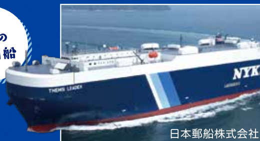
日本郵船株式会社