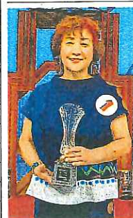
28日放送、1722回入賞者は次の通り。◇チャンピオン＝水戸マスマ「待ちくたびれて」千葉市若葉区