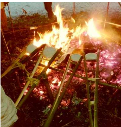
割った竹にはさんで焼きます

今年、近年に ない積雪に見舞われた朝 でしたが、肝川のどんど には、つつじが丘、猪名 川台からも参加される方 がいました。 餅などを焼き、それを食べることに により、無病息災を願うとい う行事です。 倒し、残り火で の「恵方」に 竹などを組み合わせた ものに火をつけ、その年 われました。