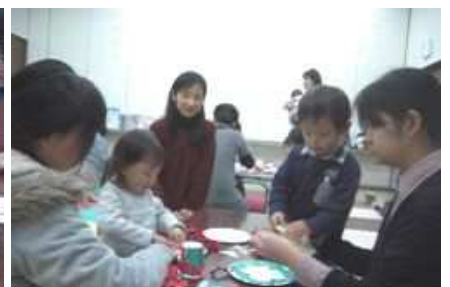
ちぎってペタペタ貼って・・・