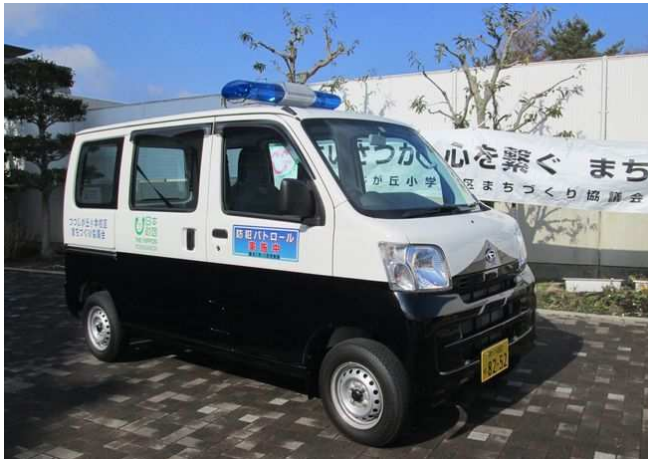
警察庁の協力で白黒塗装が認められた専用車

一月二十一日（土） 気温は低いものの暖かい日差しの中、つつじが丘小学校で青パト出発式が開催された。これは当まちづくり協議会が、日本財団の助成金を得て購入した青色防犯パトロール専用車両のお披露目となる催しである。