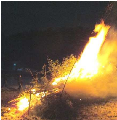
暗いうちに火をつけます