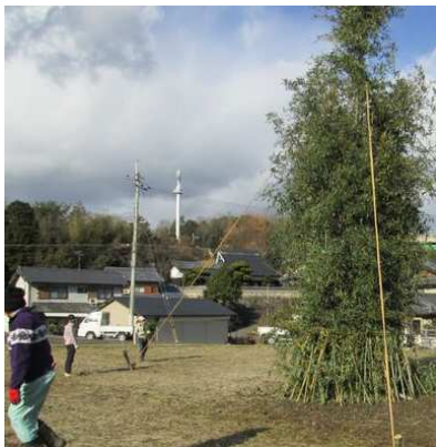
竹を組み合わせて立てます