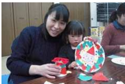
ほら、きれいに出来上がり！