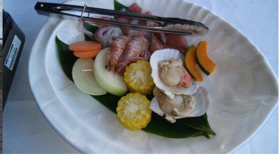
※海に面したテラスでの海鮮バーベキューの夕食