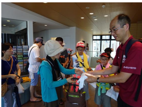
※添乗員が同行して会場に到着