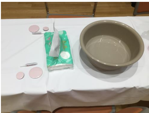
※ブローチ作りセット