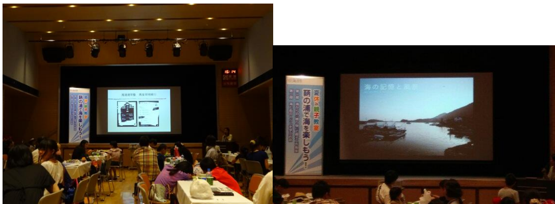
※海と私たちの暮らしのかかわりについて学ぶ