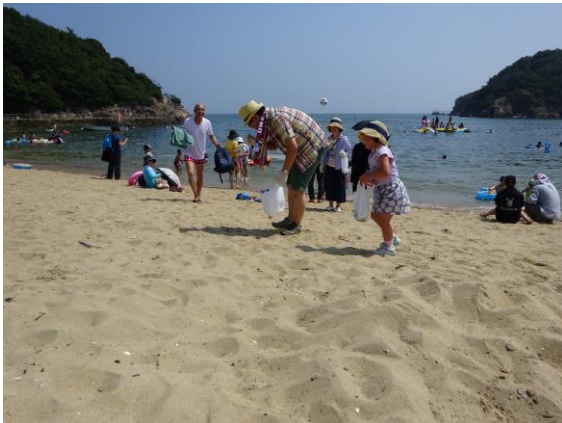
※「海からの贈り物」を収集中