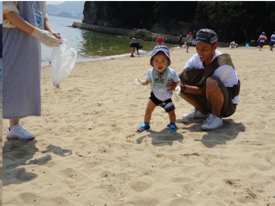
※親子で海に親しむ