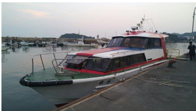
※利用したチャータークルーズ船