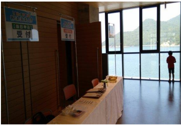
※受付より海を望む