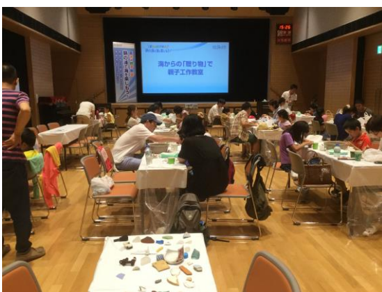
※ブローチ作りに挑戦