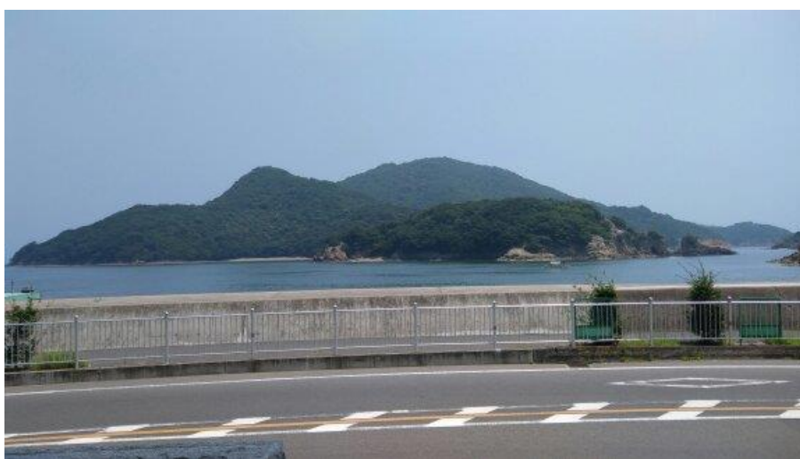
※会場前から鞆の浦の海を望む