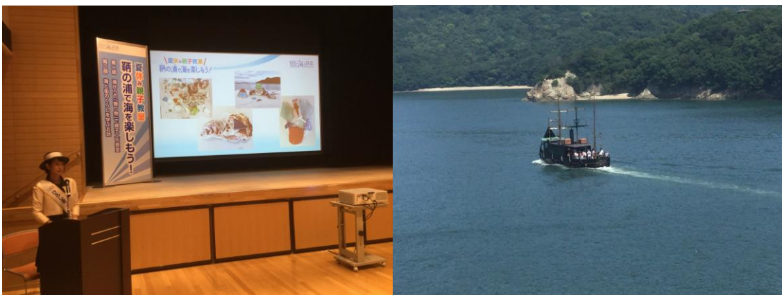
※司会進行の「ひろしま、宝しまレディ」 ※船に乗って仙酔島へ