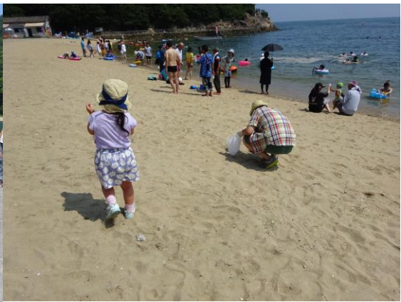
※「海からの贈り物」を収集中