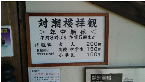
※対潮楼より海を望む