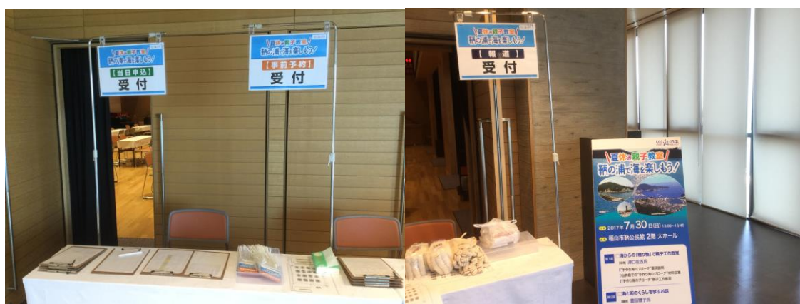
※会場の受付と看板