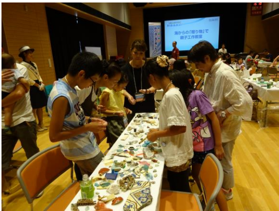
※集めた「海からの贈り物」