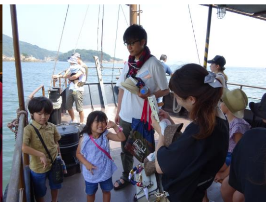
※「平成いろは丸」で仙酔島へ向かう