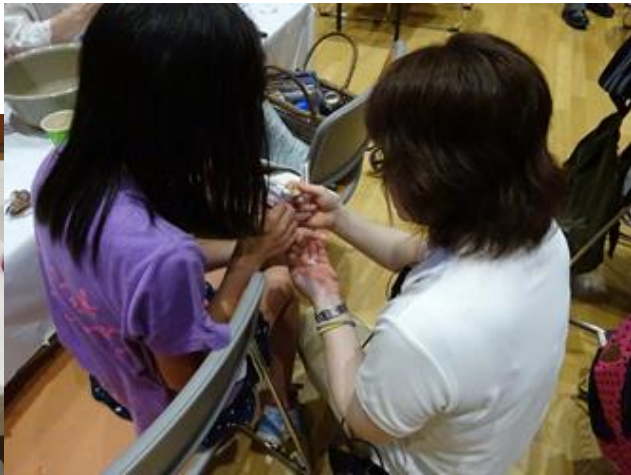
※親子でブローチ作り