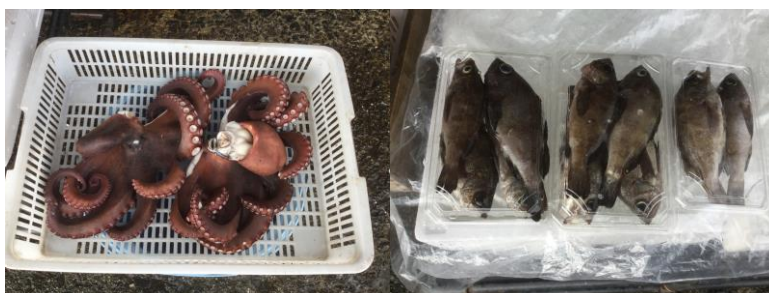
※海とのかかわりが深い「観の浦」