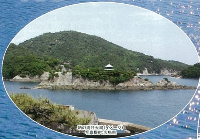
鞆の浦弁天島(イメージ)