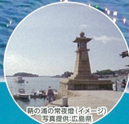
鞆の浦の常夜燈(イメージ)