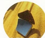
カンバッジ(ブローチ)(イメージ)

市営渡船「平成いろは丸」で仙酔島へ渡り、海で貝がらなどの材料を集めて、オリジナルのカンバッジ(ブローチ)を作って持って帰ります。