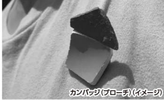
カンパジ(ブローチ)(イメージ)

鞆の津ミュージアム学芸員。東京藝術大学大学院修士課程修了。2013年にミュージアムの母体である社会福祉法人 創樹会に入職後、母体が運営する障害者支援施設で生活支援員としても勤務しながら、展示会の企画・運営に携わり始める。共同で企画した展示会に『ヤンキー人類学』『花咲くジイさん〜我が道を行く超経験者たち〜』『スピリチュアルからこんにちは』『障害(仮)』。企画した展示会に『凸凹の凹凸〜さわってみるこの世界』『Re:解体新書』『原子の現場』がある。福山大学非常勤講師。