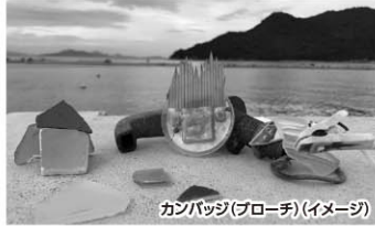
カンパジ(ブローチ)(イメージ)