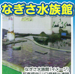
なぎさ水族館(イメージ)磯の生物に触れて遊べるタッチングプールが人気。