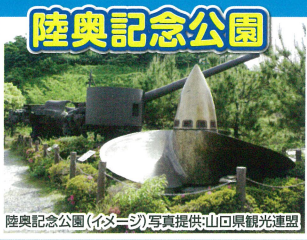
陸奥記念公園(イメージ)戦艦陸奥と将兵の冥福を祈り、未永く平和を願うため、乗組員の遺品や遺族から寄せられた資料を保存展示しています。