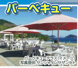
バーベキュー(イメージ)地引網で獲ったばかりの魚介類をリゾートホテルのビアテラスでバーベキュー