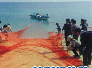
地引網(イメージ)