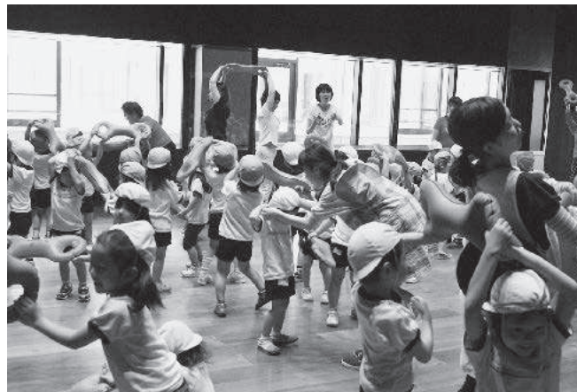
3B体操で盛り上がる園児