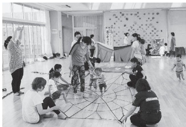
親子で遊ぶC5 忍者ランド