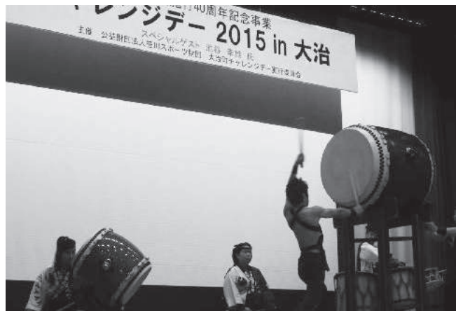
オープニングを盛り上げる大治太鼓

初挑戦ということもあり、どんなプログラムを実施すると興味を持って参加していただけるか、どれくらいのプログラムを用意すればよいか、手探りの状態からのスタートで不安を感じました。他の自治体の担当者にお話を伺いながら、実行委員と少しずつ準備を進めていくことで、企業、団体、住民など多くの方に参加いただくことができました。準備から当日までは大変でしたが、終了後は充実感に満たされました。