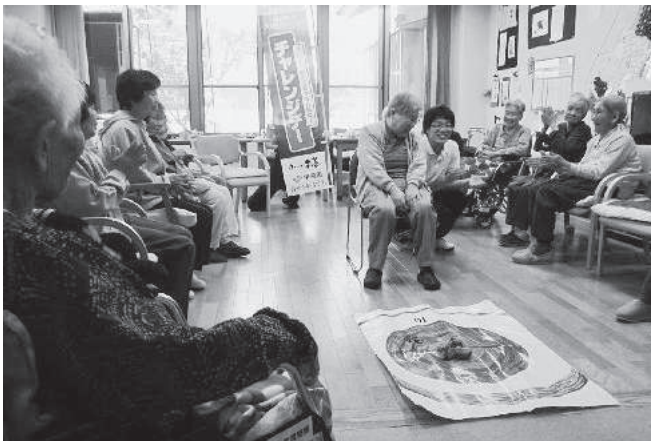
みんなで健康づくり