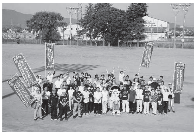
オープニングイベント

事務局スタッフ(動員できる職員)が少ないため、来年はもう少し多くの職員やボランティアを配置し、系統だった組織で臨みたいと思います。