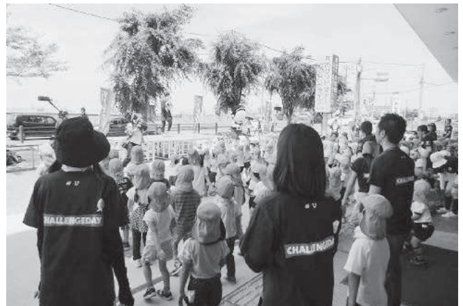
みんなで元気!! 幼児向けヒップホップ講習