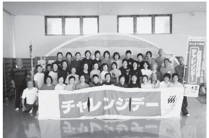
太極拳合同練習後の記念撮影