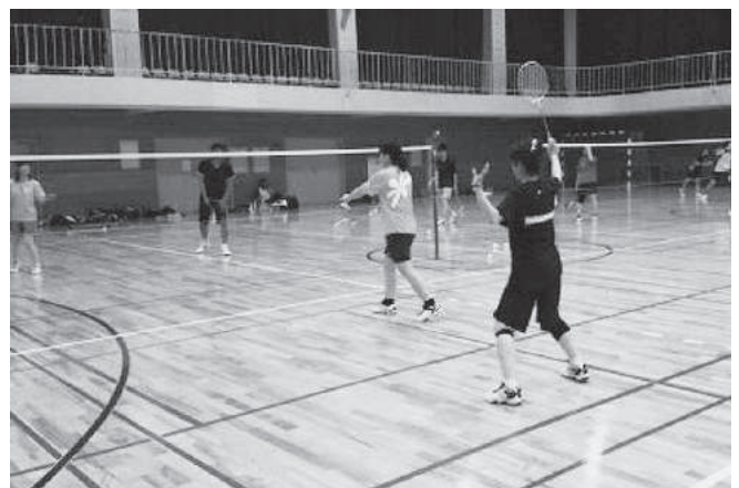
バドミントン教室