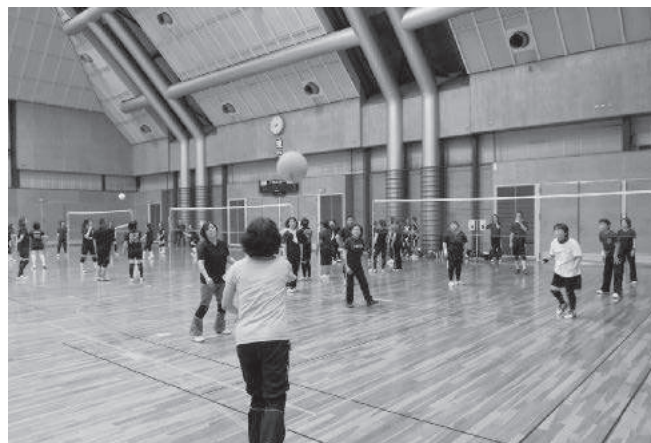
ソフトバレーボール大会