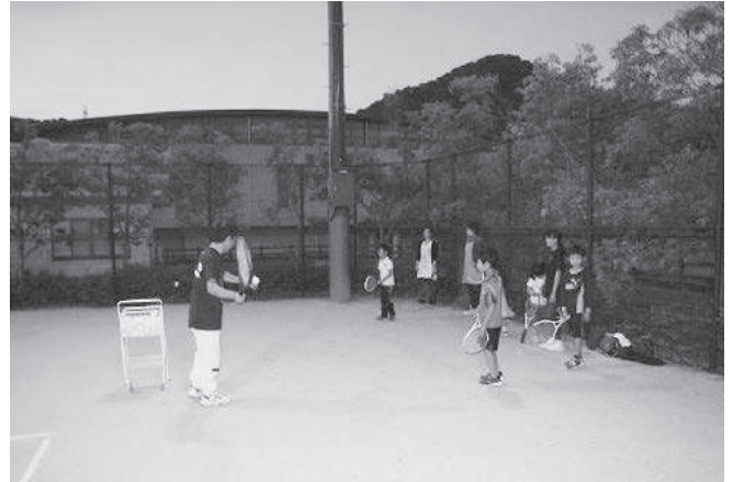
硬式テニス体験会

チャレンジデーTシャツを、スタッフ全員が早い段階から毎日着用しておりますと、色々な方から声かけをされました。「今年の対戦相手はどこ?」「もうチャレンジデーの時期なんですね!」「Tシャツかわいいから欲しいな~」などなど。私自身チャレンジデーに対する思いは、正直なところ大きなプレッシャーで押しつぶされそうになりますが、このような声を頂くと、今年も頑張ろう!また、少しでも喜んでもらえる内容にしようと勇気を頂きます。今年も大変でしたが、スタッフのチームワークも取れて、良い経験になったと思います。