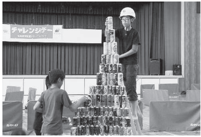
空き缶積み上げ大会