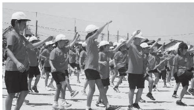
小学生によるはるちゃん体操