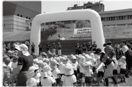
2015年7月号 広報かしわら

5月27日(水)、全国130カ所でチャレンジデーが実施され、約277万人が参加しました。柏原市は皆様のご協力をもちまして、参加率68.2%(人口72,062人、参加49,138人)を記録し、対戦相手であった東京都狛江市(参加率18.3%)に勝利することができました。皆様のご協力ありがとうございました。