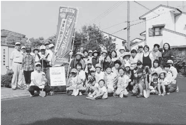
地域自治会「ひまわり種植え」