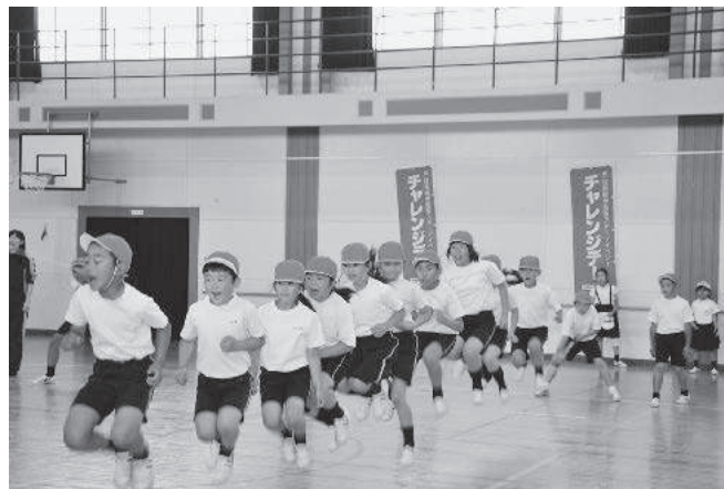
ロープ・ジャンプ・EX

最後に、運動を日頃からしてみようと思われる方が増えたと感じました。このような方を増やすべく、今後も取り組んでいきたいと思っています。