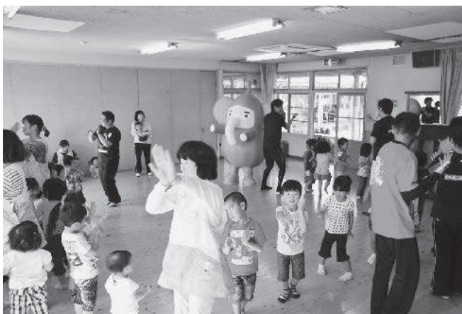
北広島町オリジナル「きたひろ音頭」