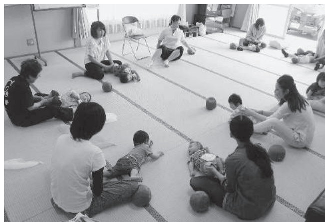
親子で楽しむエクササイズ