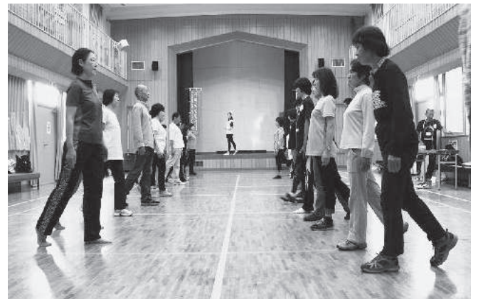
ポスチュアウォーキング

また、区長会からも体を動かしても報告しないと何にもならない!と報告率を上げるために区民に呼びかける等、市民一丸となり勝利しようという機運を感じました。今回のチャレンジデーは今まで一番盛り上がり、お祭りとして市内各所で自主的に多くのイベントが開催され、市民がみんなで一日を楽しむことができました。