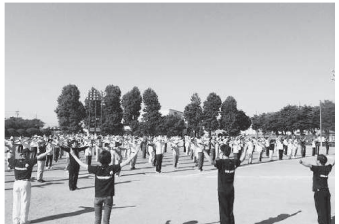
町長とラジオ体操

引き続き、日常生活に 15 分以上の運動を取り入れる啓発活動を行い、扶桑町らしい健康なまちづくり推進を図っていきたいと思います。