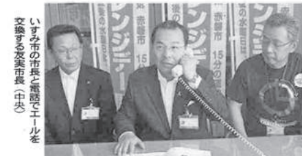
いすみ市の市長と電話でエール交換する赤磐市長（中央）