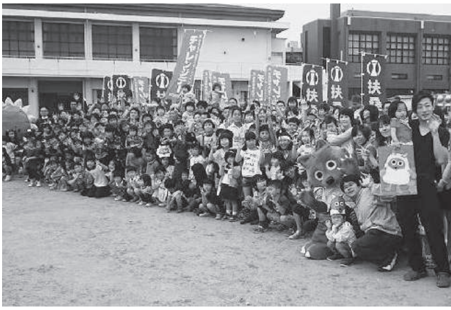
メ〜テレ「踊ろう!ウルフィ〜ズ」