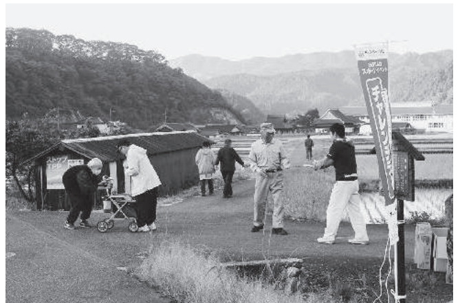
104歳、元気にウォーキング