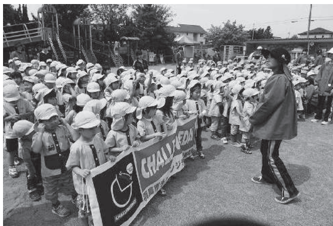
幼稚園ではみんなで体操です