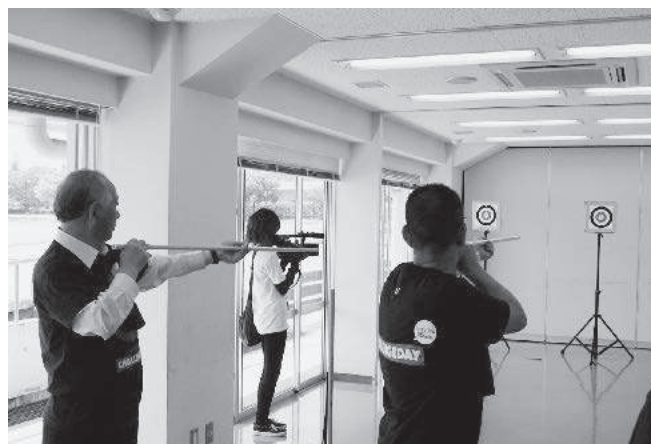
市長と教育長はスポーツ吹き矢にチャレンジ!