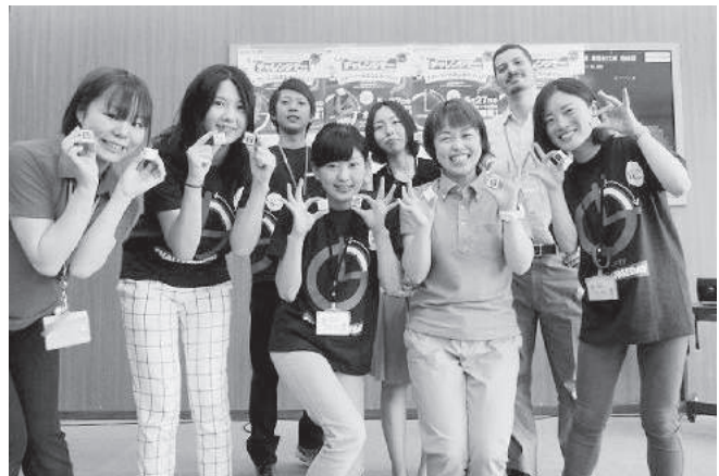
参加賞のオリジナルチョコチョコ！