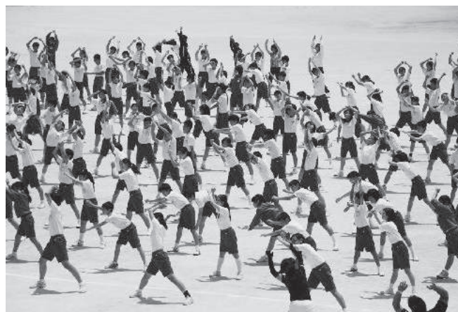
中学校全体「ラジオ体操」