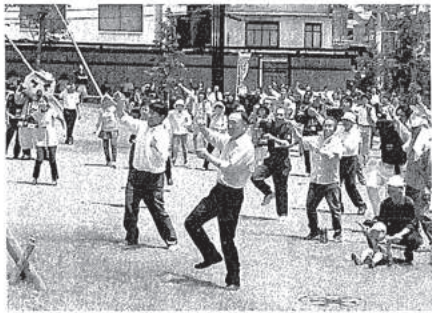
チャレンジデーのイベント玄さんとダンスで汗を流す豊岡市市民ら。豊岡市中央町で。

豊岡・養父両市では、参加率を上げるために各地でイベントが企画された。豊岡市中央町の市役所前市民広場では市民、市職ら約400人が参加し、市のマスコットキャラクター「玄武岩の玄ま