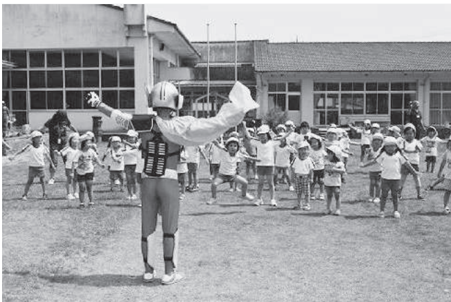
チャレンジマンと一緒にラジオ体操