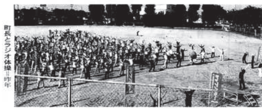
2015年5月22日 金曜日 尾北ホームニュース

施設：グラウンドなど 役場、中央公民館、図書館、ボートハウス、健康センター、福祉センター、各町会等。吹矢、健康体操、フットボール、各町会等。吹矢、健康体操、フットボール、各町会等。