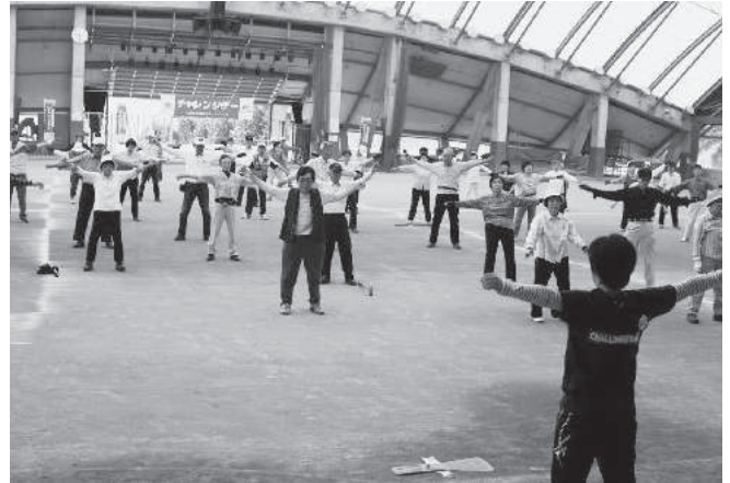
グラウンド・ゴルフ教室

市体育協会、市スポーツ推進委員会や地域のスポーツクラブ21など、様々な団体や地域の人々と連携できたことが良かったと思います。しかしながら、平日の実施となるため、イベントを計画するのが難しいと感じました。グラウンド・ゴルフなど、高齢者の方を対象にしたものが多くなってしまっているので、その点が苦勞しました。