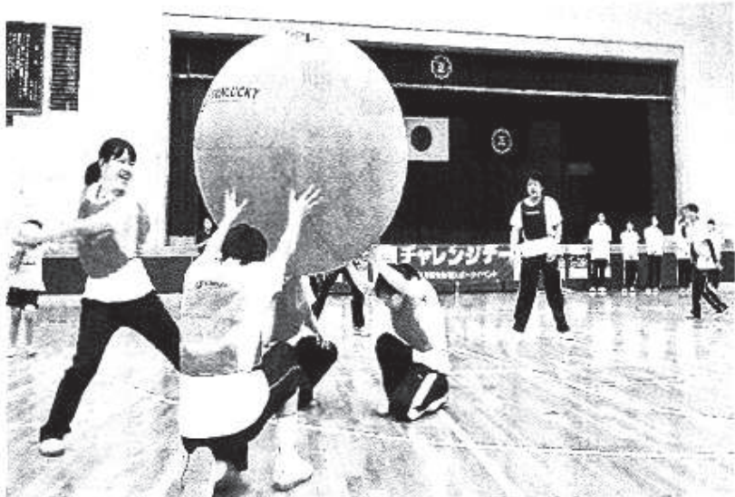
チャレンジデーでキンボールを楽しむ参加者たちー羽島市正木町坂丸、正木小学校