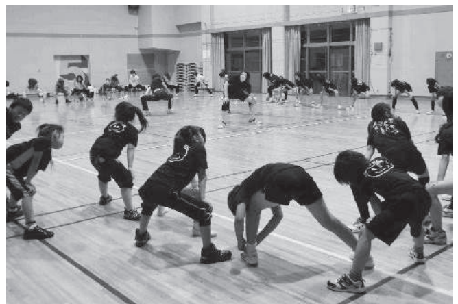
シーガルズのストレッチ教室