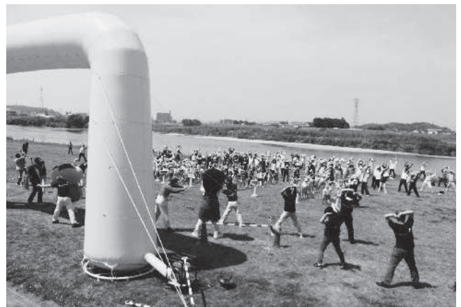
市長と体操・ゲームをしよう!!

チャレンジデー当日は両市がNHKの取材を受け、各々の地域のニュースで放送される等、両市間の交流が広がったのももちろんのこと、テレビ放送を通じて、両市及びチャレンジデーというイベントのPRを図ることができたことについて、大変うれしく思っております。