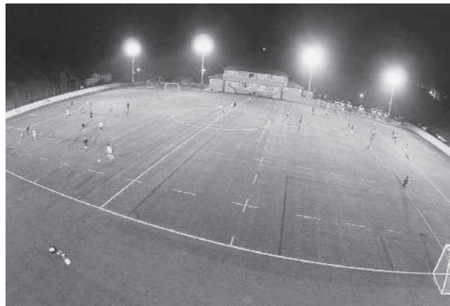
ミニサッカー大会