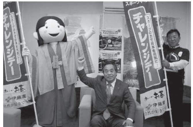
エール交換で「がんばるぞ!!」

また、毎年チャレンジデーに参加したいとの思いで、近所を散歩して体力づくりを続けられている 104 歳の村民もいらっしゃるなど、自治体対戦の勝敗ももちろんですが、「スポーツを楽しんで健康になりましょう」の目標を掲げながら、これからも取り組んでいきたいと考えています。