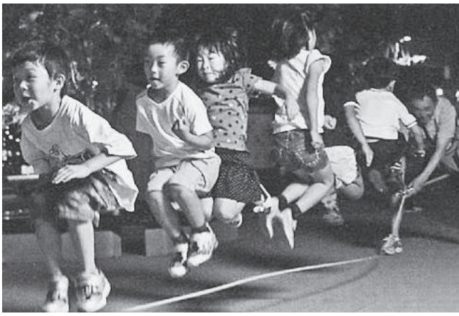
ロープ・ジャンプ・X大会