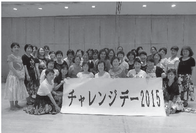
フラダンス講習会后にみんなでポーズ