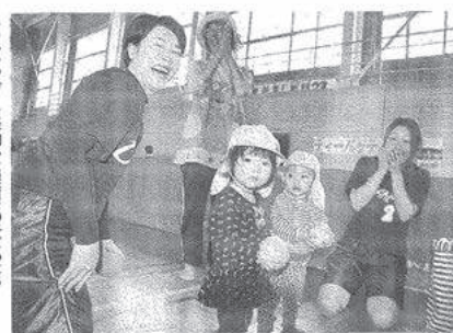
チャレンジデーに参加した保育所の子どもたち。雲南市の延伊体育館で

人口規模の近い自治体同士でスポーツイベントへの住民参加率を競う「チャレンジデー」の27日、雲南市はラジオ体操、ゲートボール大会、ウォーキング大会などさまざまなスポーツの催しを開いた。 チャレンジデーは雲川スポーツ財団主催。雲南市は秋田県鹿角市と対戦した。27日午前0時から午後9時までの間に、15分以上運動した住民の数を報告する。 雲南市の延伊体育館では、近くの保育所の子どもたちや県立出雲看護学校雲南分校の生徒たちが参加。バタゴルフ、スポーツ吹き矢、バスケットボールのフリースローなどを楽しんだ。 市教委によると、昨年の参加率は57.3%。勝ち負けよりも、楽しみながら体を動かし、健康増進や住民交流につなげることが狙い。チャレンジデーで敗れた場合、相手自治体の旗を庁舎に1週間掲揚する決まりがある。雲南市と鹿角市は今回の対戦を前に、勝っても負けてもお互いの旗を掲げてたてる予定にしている。【山田英之】