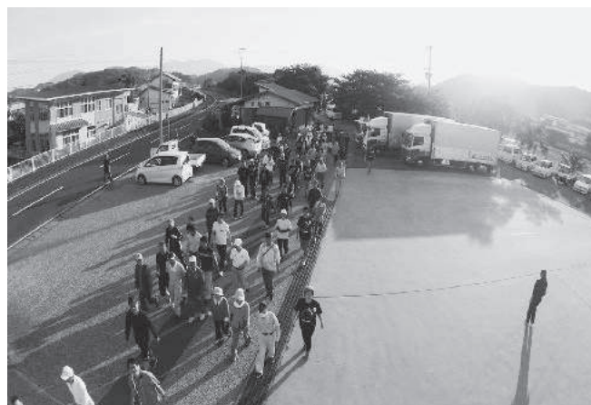
早朝ウォーキング

ただ、ラジオ・チラシ・新聞など事前告知を行いました。次の日に報告が入ったり、連絡忘れがあったりとどうすれば良いのか、毎回いつも悩みます。