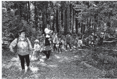
Gボールやウォーキング 村民ら1005人

チャレンジアーは毎年5月の最終水曜日に開催され、15分以上運動した人の人口に対する割合を競い合う。人口規模に合わせて6部門あり、部門ごとに主催者が決めた自治体同士で対戦。全エントリー自治体で参加率の高さを争う。新庄村は2006年から10年連続で4999人以下の部に出場した。 新庄村は「チャレンジアー」は村民の体方向上にも一役買っている。村民の参加率100%を目指し、来年は新庄村リベンジしたいと意気込み込んでいる。 1・8%を1.9%増し、村民自らの参加率も2.1%増の65.8%を記録。秋田県上小阿仁村（64%）との対戦も大差で制した。 1位は、過去2回の優勝経験を持つ青森県新郷村（1.7%）。新庄村が13年に直接対決で敗北を喫した相手で、14年は全体成績で回ったが、宿敵に主座を奪還された形だ。 新庄村は「チャレンジアー」は村民の体方向上にも一役買っている。村民の参加率100%を目指し、来年は新庄村リベンジしたいと意気込み込んでいる。