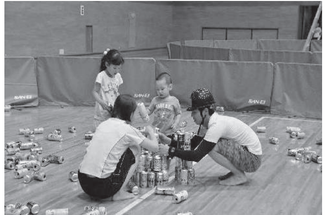
空き缶積み上げ大会

来年度も、赤磐市全体で体制を整えて臨み、今回以上に市民の自主的参加を呼びかけていくことで、継続的な運動の実施につながることを期待しています。