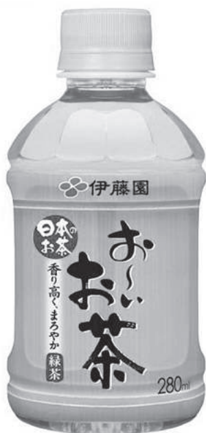
「おーいお茶 緑茶 ペットボトル」280ml 10ケース（1ケース24本入）