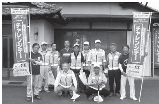
スポーツごみ拾い（埼玉県秩父市）