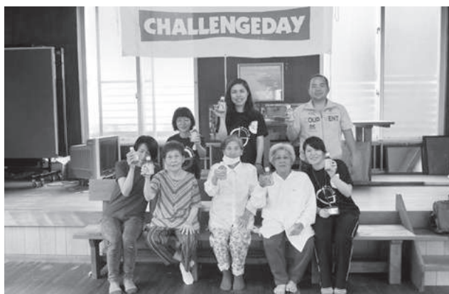
公民館で集合写真（沖縄県大宜味村）