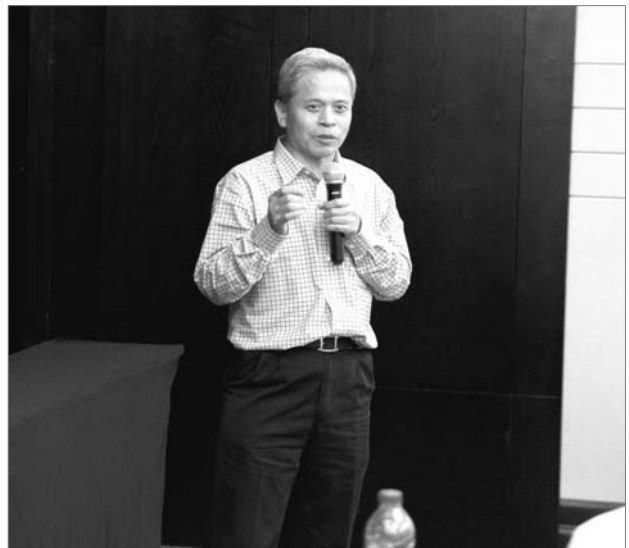
■ 图为浙江大学段树民院士在会上致辞