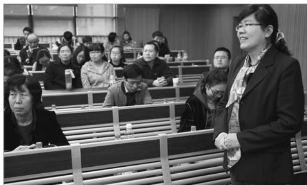
■ 图为学员在课堂上积极发言