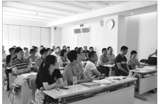
■ 图为学员正在认真听课

中日笹川呼吸与危重症骨干医生培训班于2017年8月1日至8月9日在中日友好医院举办，参加学员来自贵州、云南、四川、湖南、湖北、青海、安徽、辽宁、河南、黑龙江、重庆市、广西、内蒙古自治区、新疆、西藏等地共30人。