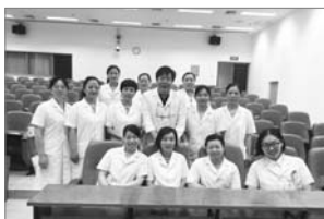
■ 北京协和医院妇科急诊医学培训班

以及相关工作人员表现出的高水平、高素质，是本次培训项目如此成功的决定性因素。各个培训项目负责人还专门为此编写了教材，培训内容十分丰富、实用，得到了学员们的一致好评。