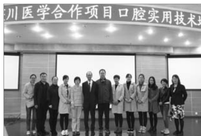
■ 华西口腔实用骨干技术培训班