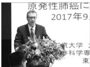
■ 东京大学医学部呼吸器外科中岛淳教授在会上发表演讲