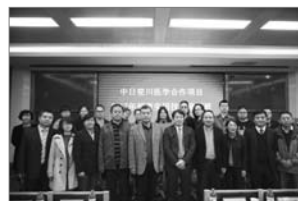
■ 西安交通大学第一附属医院超声应用技术培训班