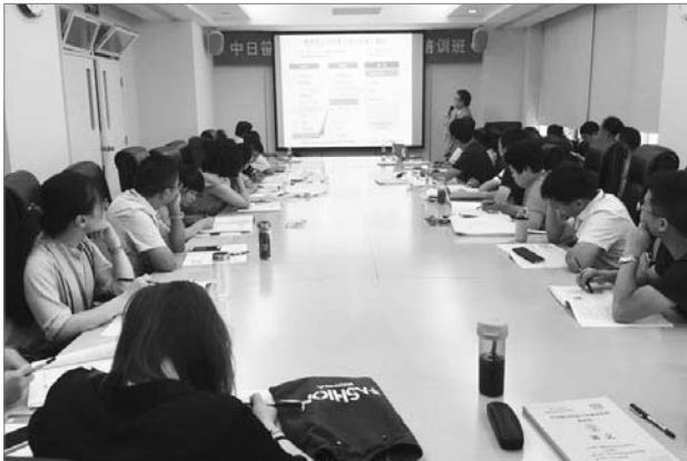
■ 图为顺天堂大学高桥和久教授在给学员上课