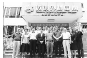
■ 湘雅医院第二附属医院腹腔镜实用技术骨干人才培训班