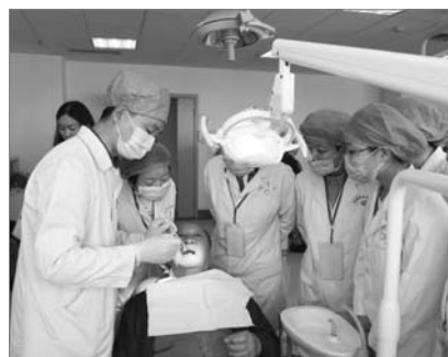
■ 图为学员在参观实习