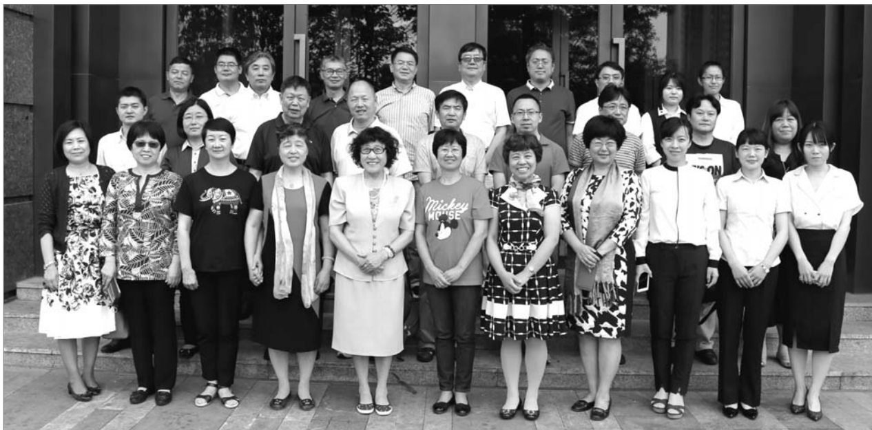
■ 图为参会人员合影留念

与会专家对同学会的各位老师们的付出和会议的准备都给予了极大的肯定，希望今后同学会的活动更加丰富多彩，多地区的联谊、召开联合研讨会是个非常好的契机，大家可以增进了解和互通。同学们纷纷表示，今后会更加积极主动的参加集体活动，为同学会献计献策。学员们都一致认为北京和天津联合举办学术研讨会，可以让两个地区的同学会的成员加深了解，增进友谊，互帮互助，共同进步。