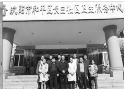
■ 图为学员在参观教学地合影留念