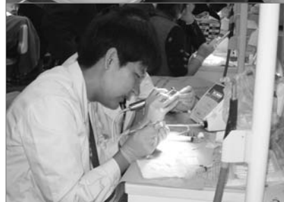
■ 图为学员在进行实践操作