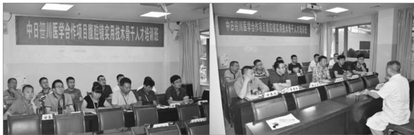
■ 图为学员在认真聆听教授的课程

所有参加本次培训的学员均表示本期培训的人文关怀是所有培训最难忘的一次，从李永国教授的人文讲座，到培训方案的制定和调整，再到涪川同学会的欢迎仪式，所有学员和培训方的关系处理极为融洽，