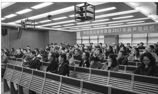
■ 图为学员在认真听课