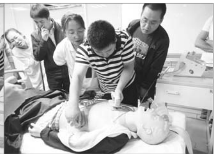
■ 图为学员在接受 AHA 培训