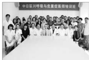
■ 中日友好医院呼吸与危重症骨干培训班