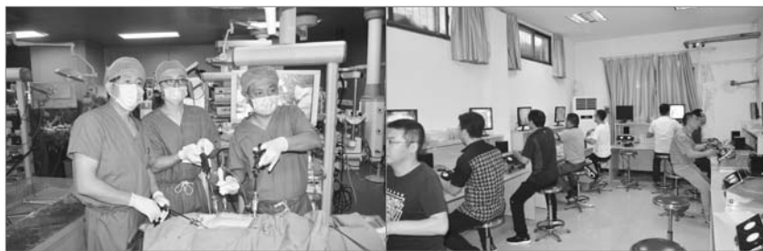
■ 图为学员在进行实习操作

科常用腹腔镜技术专题讲座：腹腔镜胃癌根治术的要点及手术技巧，一体化手术室的使用和管理，双镜、三镜在肝胆结石疾病中的联合应用，ERCP在肝胆胰外科的应用，腹腔镜减重代谢手术，腹腔镜甲状腺手术要点及技巧，腹腔镜直肠癌根治术要点讨论，完全腹腔镜胃癌根治术消化道重建，安珂乳腺微创旋切手术经验交流，腹腔镜手术疑难情况处理等。