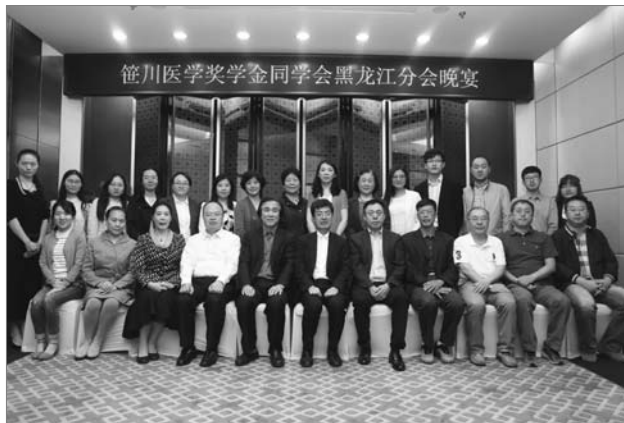
■ 图为参会者合影留念