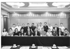
■ 图为参会者合影留念