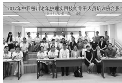
■ 四川大学华西医院老年护理实用技能骨干人员培训班

2017年度的中日笹川医学奖学金合作培训项目终于在各方合作单位的共同努力下顺利结束！本次培训工作先后在北京、西安、沈阳、长沙等地开办了7个培训班，接受培训者共114人。培训机构均为历届笹川生所在的工作单位，