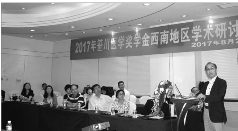
■ 图为日中医学协会副会长安达勇先生在做演讲

箴川医学奖学金同学会西南地区学术研讨会于2017年8月26日在重庆召开，本次会议由箴川医学奖学金同学会、日中医学协会主办，箴川医学奖学金同学会西南地区分会承办。本次会议可谓是大咖云集，堪称盛会。