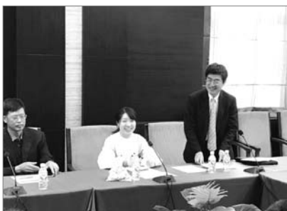
■ 图为日本医学协会监事小野喜志雄教授在会上致辞