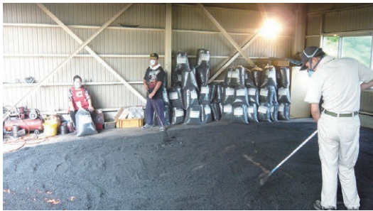
▲もみ殻くん炭製品化作業