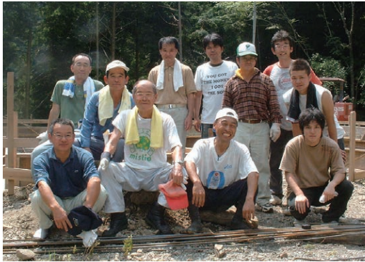
▲2006年団体設立時メンバー