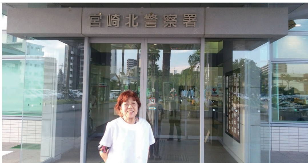
▲宮崎北警察署前にて

全く来客のないときもありますが、全く気にしていません。警察に育ててもらったと大変感謝しています。その恩返しのためにも私が元気な限り、この理容室を続けてまいります。本当にありがとうございました。