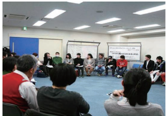
▲再非行から離れる勉強会（わかちあい）