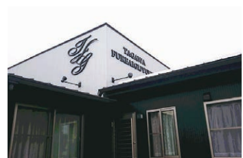
▲田川ふれあい義塾の外観