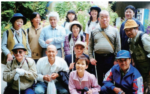
▲伊丹市 昆陽池昆虫館へ