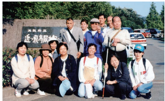
▲アスカティア古墳の杜ハイキング