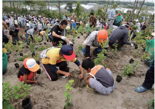
▲希望の森づくりプロジェクト海岸防災植林