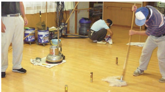
▲クリーンサービス作業風景