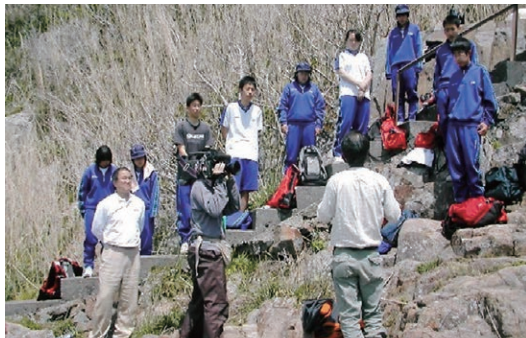
▲ 現地で拾ったカンムリウミスズメの死体などを使ったレクチャー