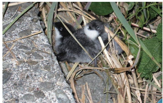
▲ 網場に現れたヒナ