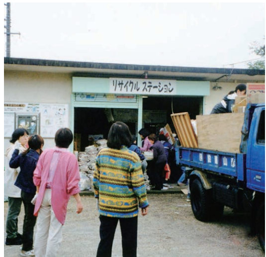
▲自主運営していたリサイクルステーション