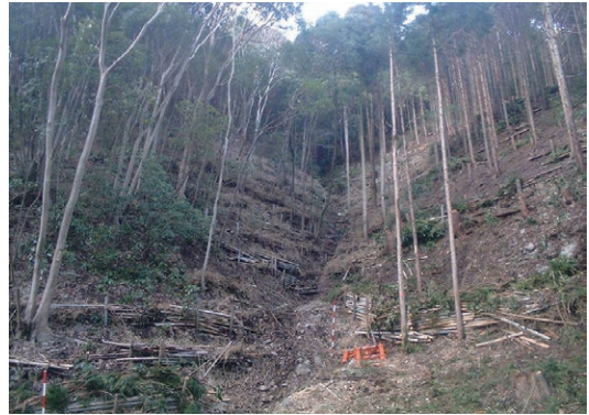
▲間伐により再生した里山