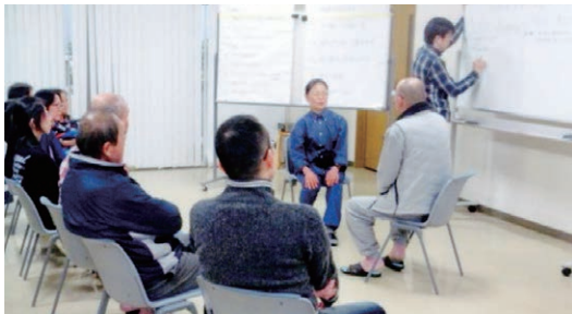
▲「もっと上手になりたい」円滑な対人関係に大切なコミュニケーションに欠かせないSST（社会スキル学習）