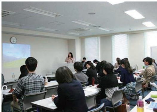
▲再非行から離れる勉強会（研修会）