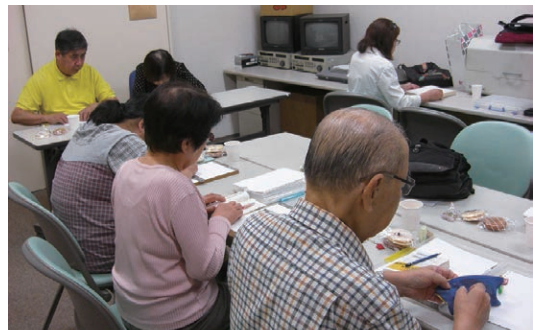
▲市の保健福祉センターで活動しています