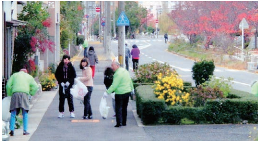
▲地域の人々に喜ばれている職員利用者一体となった地域清掃活動