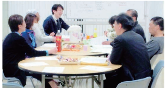
▲認知行動療法にもとづいて支援する 薬物使用生涯からの回復プログラム“ひま～ぶカフェ”