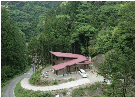
▲森と人を結プラットフォーム「森の駅」