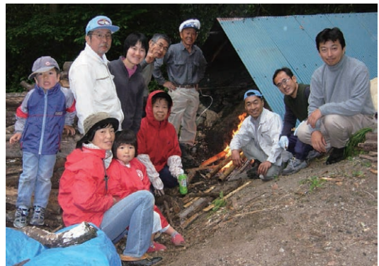
▲炭焼きで木の利用拡大