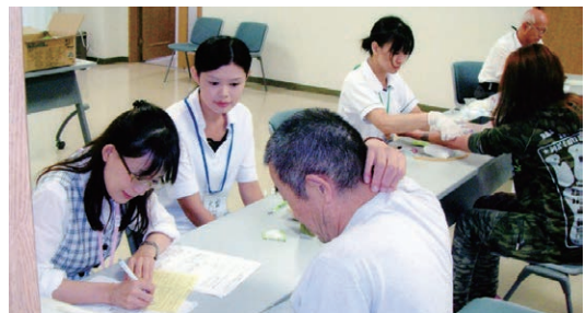
▲心身を病みがちな高齢、障がいのある利用者の定期健康診断と生活指導（社会福祉法人恩賜財団済生会病院協力）