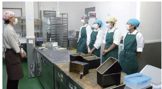
▲ベーカリー(パン屋)での朝礼写真