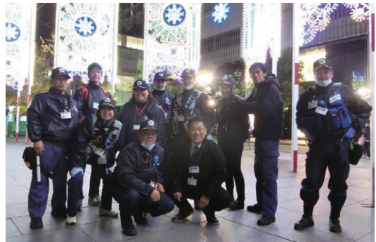
▲神戸ルミナリエにて