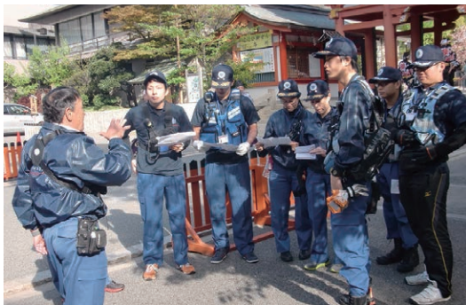
▲生田神社神幸祭救護風景