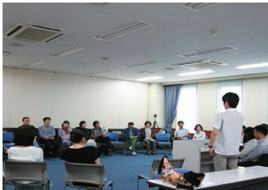
▲再非行から離れる勉強会（少年の体験談）