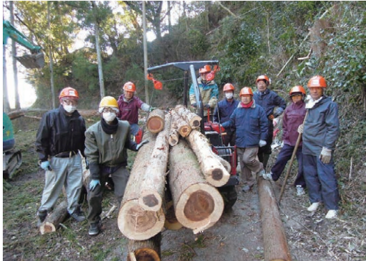
▲間伐材の搬出作業