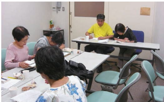
▲点訳の確認作業中