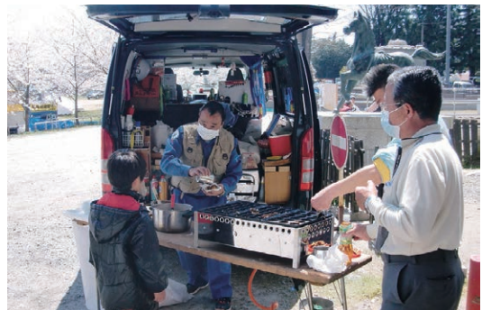
▲被災地にて炊き出し