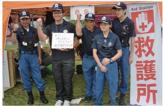
▲リレーフォーライフ救護所にて