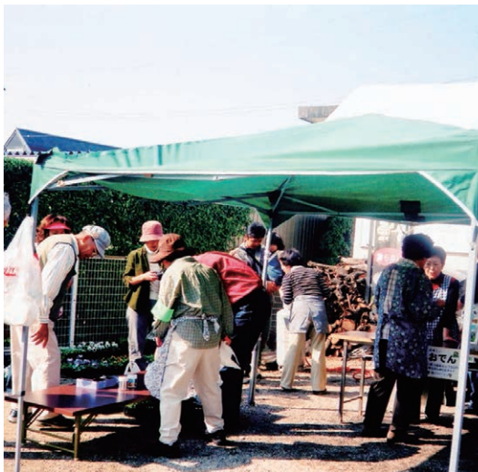
▲「三好丘自主防犯クラブ」地域の方々と