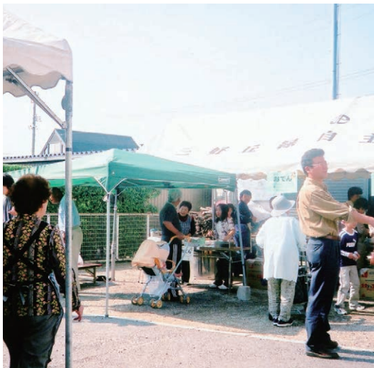
▲三好丘自主防犯クラブでの活動