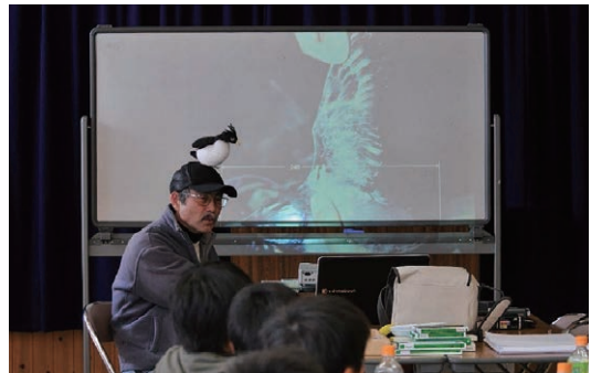
▲ 子どもたちにカンムリウミスズメのことを知ってもらうイベント