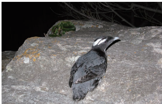
▲ 帰島したカンムリウミスズメ

最後に2016年までは、渡船代や調査船の借り上げ料など全てのことを自己資金で行ってきましたが、最近は門川町の補助があり非常に助かっており感謝しております。