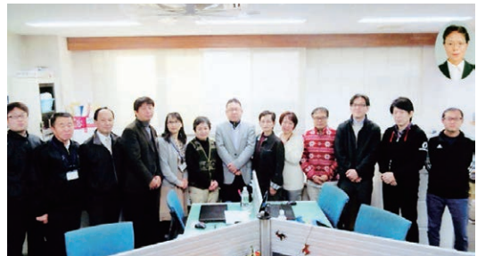
▲久々に全員集合した調理、事務、補導スタッフ