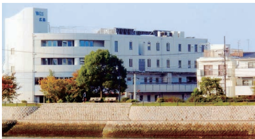
▲元安川沿いに建つウイズ 高齢女性利用者の増加に19年度着工予定として定員6名の別館施設を建設予定