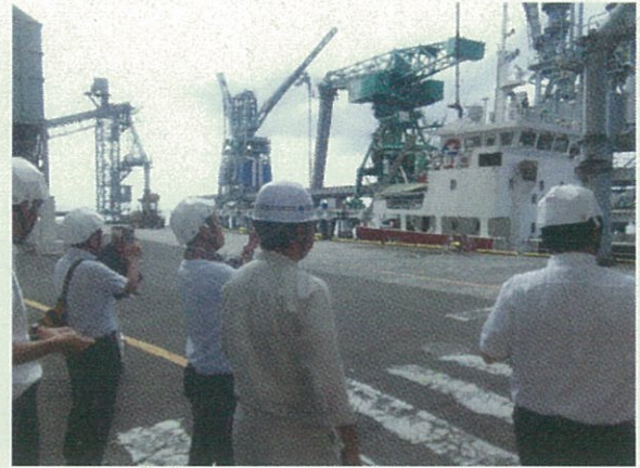
アンローダーによる荷役風景