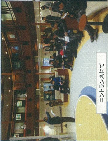
エントランスにて