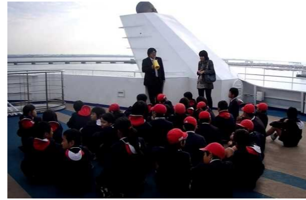
オーシャンアローの見学開始