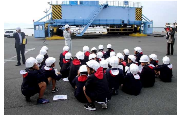
熊本コンテナターミナル見学