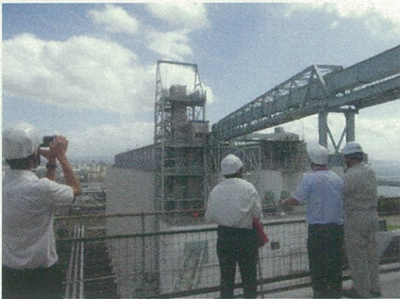
屋上からの施設外観