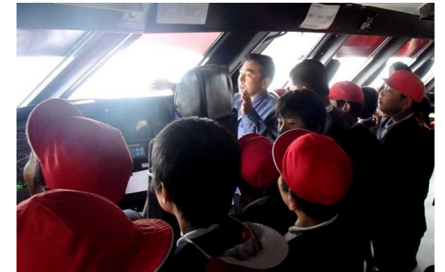
オーシャンアロー船長の説明