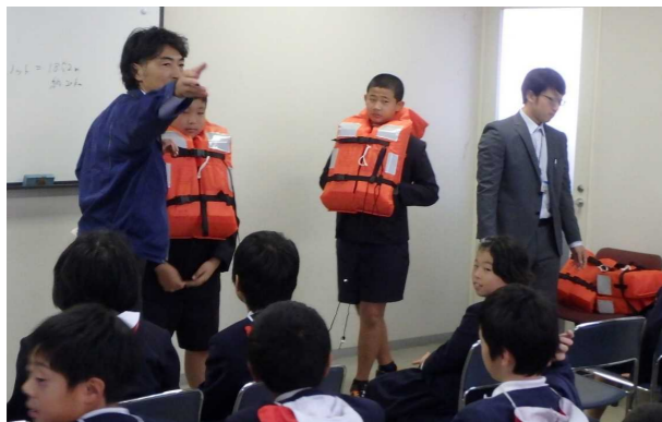
有明フェリーで救命胴衣着用体験