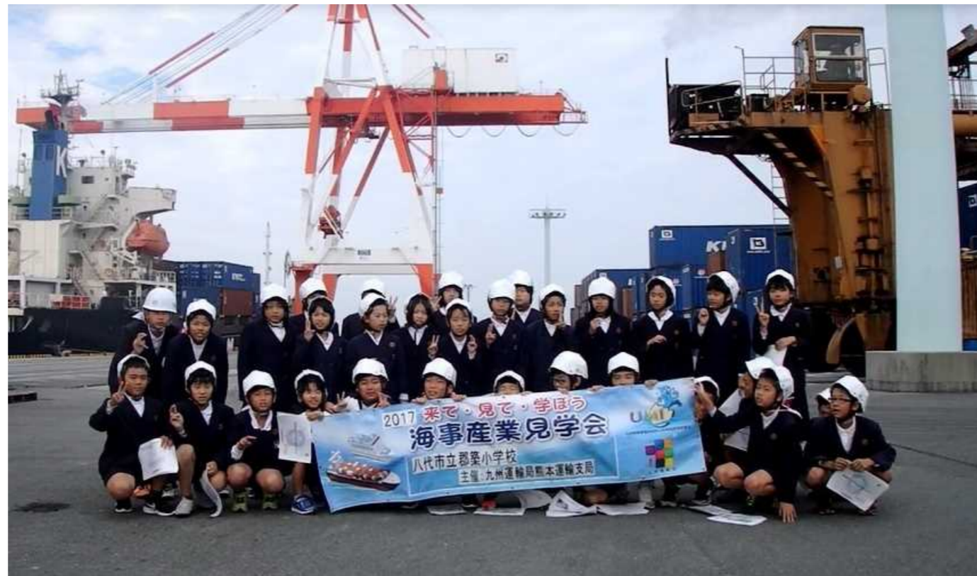
ガントリークレーンの前で集合写真