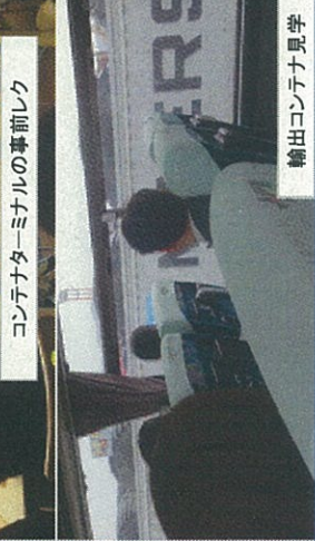
輸出コンテナ見学