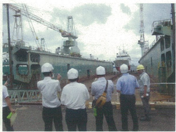
フローティングドック