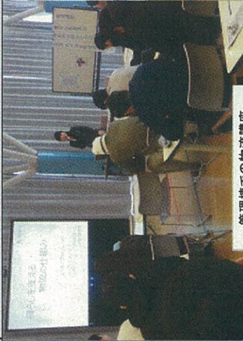
管理棟での物流講座