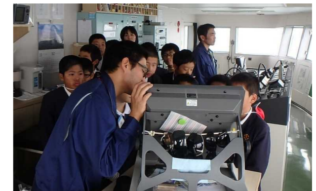
有明フェリーの船橋見学