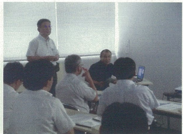
鹿児島～沖縄航路などの概要説明