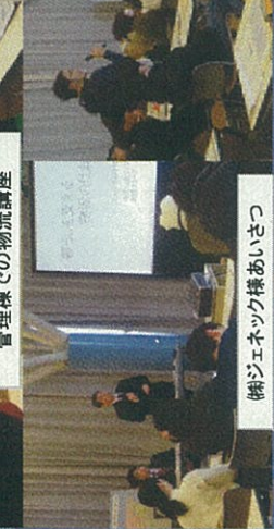
㈱ジェエネット様あいさつ