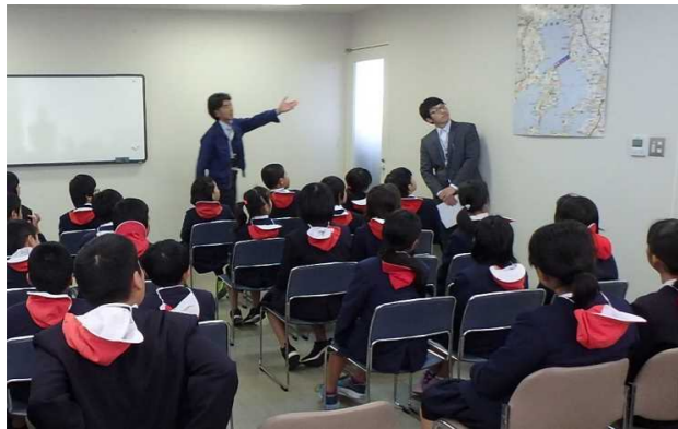
有明フェリーで勉強