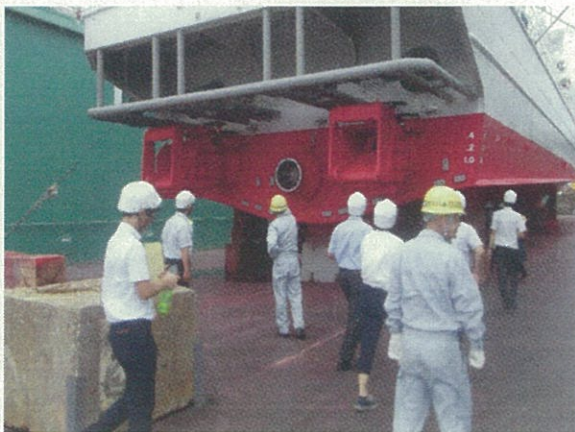
滅多に見れない船の底を見学