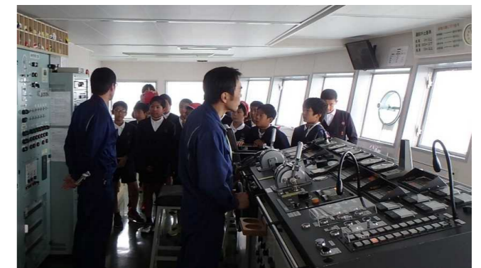
有明フェリーの船橋見学