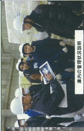
庫内の管理状況説明