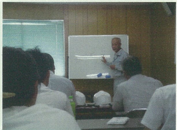
会議室で造船所の概要説明