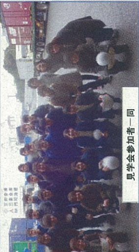
見学会参加者一同