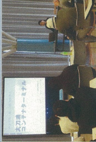
コンテナターミナルの事前レク