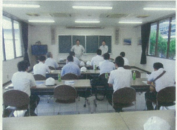
大型サイロの概要説明