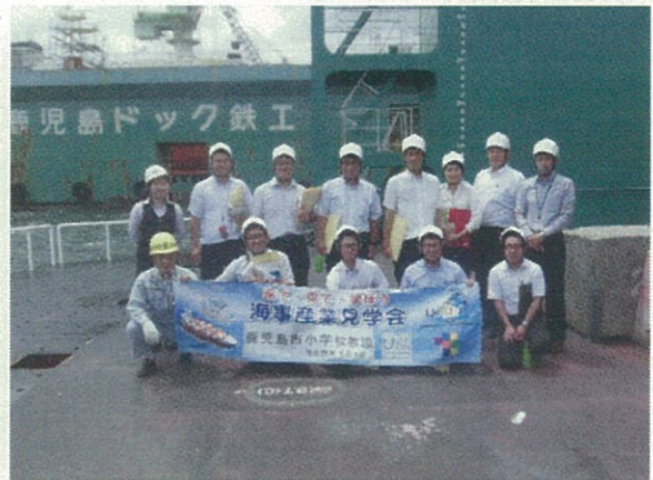
フローティングドックで写真撮影