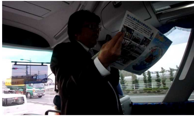
当支局職員の説明