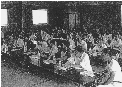
④（香川県地区、高松市 サンポートホール高松、 4月12日）