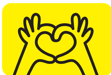
その他・サービス

ぜひこの運動の理念にご共感いただき、運動へのご参加や、 ご自身のお気持ちに合った方法でのご支援をお願いいたします。