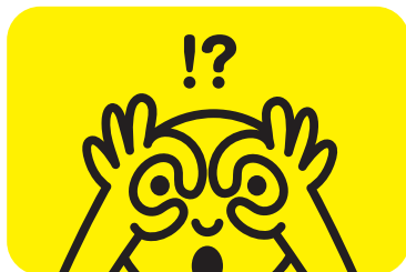
見えかたの不思議