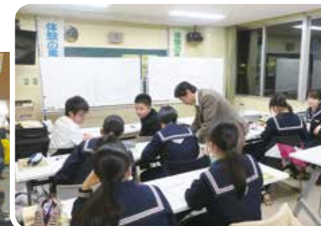
受験生向けゼミナール (北海道積丹町)