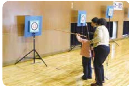
初めてのスポーツ吹矢 (岡山県矢掛町)