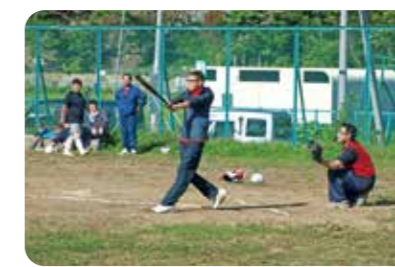
青年部主催ソフトボール交流会 (北海道積丹町)