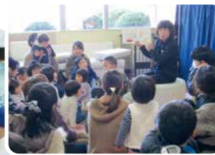
読み聞かせ (兵庫県篠山市)