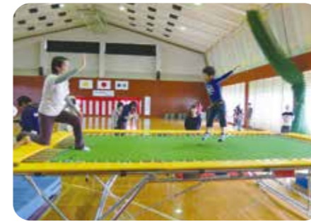
トランポリンの指導 (熊本県湯前町)

ボランティア活動を希望する住民に協力を依頼し、定期的な運動教室が開催されています。様々な活動でサポートを務めるなど、ボランティアが活躍するようになりました。