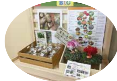
特産品の展示・販売コーナー (岐阜県中津川市加子母)