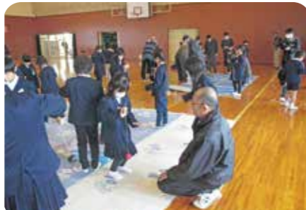
昔遊びによる三世交流 (岡山県美作市作東)