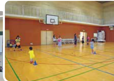
放課後子ども教室 (北海道積丹町)