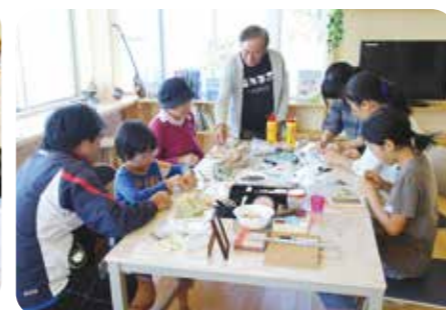
艇庫でアクセサリづくり (鹿児島県与論町)