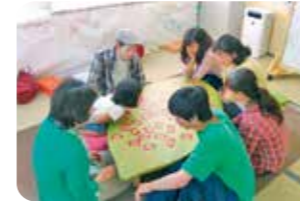
誰もが気軽に過ごせる居場所 (岡山県奈義町)