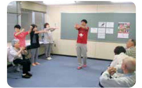
高齢者教室の指導サポート (熊本県湯前町)