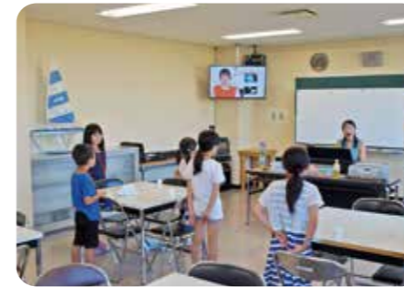
放課後音楽クラブ (北海道積丹町)

放課後や休日など、自宅に誰もいない家庭のために、子どもの居場所を提供しています。放課後子ども教室として運用しているセンターもあります。