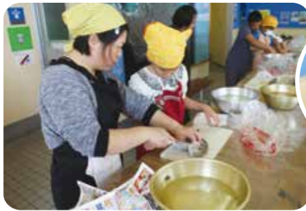
魚のさばき方教室 (鹿児島県与論町)

地元特産品の展示コーナー設置や、特産品を使った「食と健康」教室の開催など、栄養・食事の面から健康について学ぶ機会も提供しています。