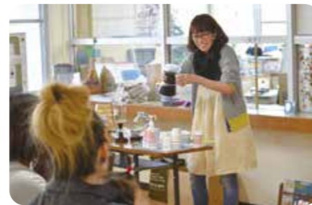
こだわりの珈琲教室 (熊本県湯前町)