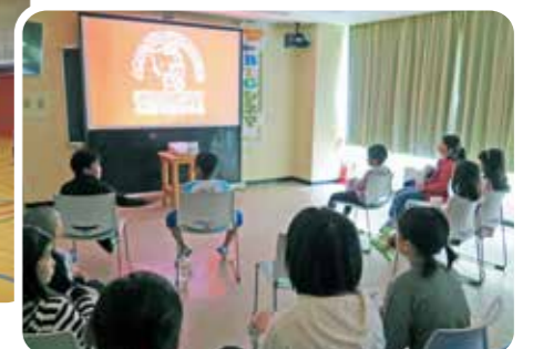
映画観賞会 (北海道積丹町)