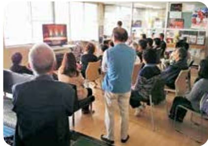
郷土芸能大会のパブリックビューイング (熊本県湯前町)

お年寄りからけん玉やあやとりなどの昔遊びを教わりながら、一緒に遊び交流を深めています。