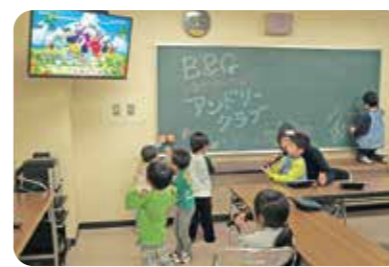
子育てサークルでカラオケ機材の活用 (北海道積丹町)

漁師の青年部では、コミュニティ施設として活用するためのイベントを企画し、多くの住民が参加しました。