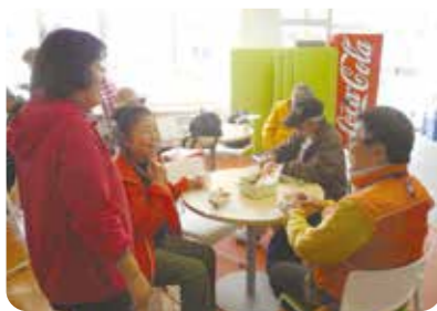
イベント後にロビーで談笑 (広島県尾道市瀬戸田)

ロビーの居住性を高め、利用者がくつろげるスペースに改修しました。お茶を飲みながら、談話や読書を楽しむことができ、スポーツ利用をしない方でも、気軽に利用できる新しい居場所の一つとなっています。