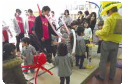
バルーンアート体験 (広島県尾道市瀬戸田)