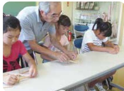
伝統工芸品づくり (島根県雲南市加茂)