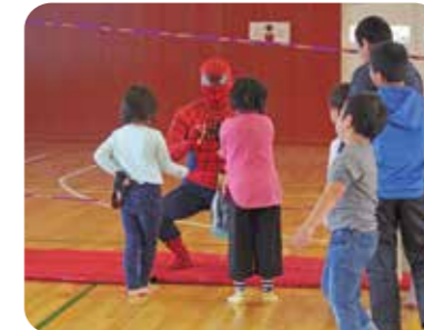
仮装でイベントの協力 (熊本県湯前町)