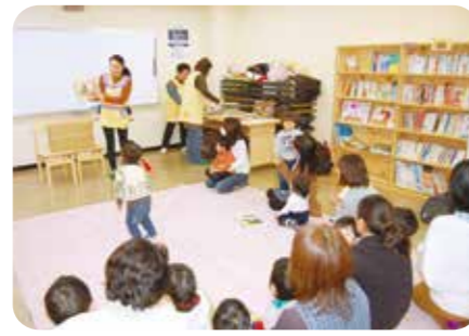
ミニ図書館で読み聞かせ (岐阜県中津川市付知)