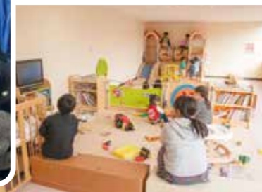
暖かみのある木製遊具 (大分県宇佐市安心院)