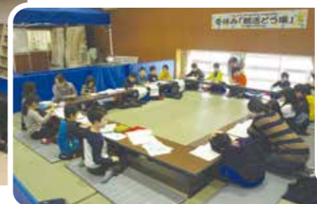
冬休みの宿題サポート (北海道積丹町)