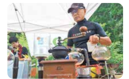
イベント時のコーヒー提供 (熊本県湯前町)