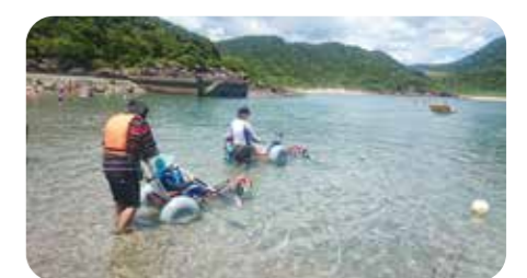
チェアボートで海へ (鹿児島県南さつま市坊津)