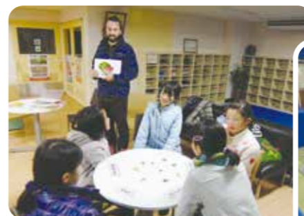
ALTの英会話教室 (熊本県湯前町)

塾講師による受験生への学習指導や、教員と連携した宿題サポートをしています。漫画を活用した英会話教室も開かれるなど、新しい学習の場として、子どもたちを支援しています。