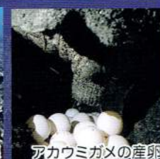
アカウミガメの産卵