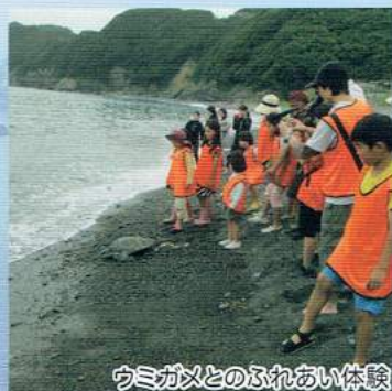
ウミガメとのふれあい体験

鶴見半島と湾内に浮かぶ島々を周遊するクルージングや、森林遊歩道や地域の名所のウォーキングなどを通して、鶴見半島の雄大な自然に触れることができます。