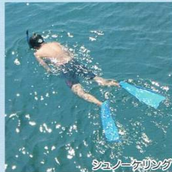
シュノーケリング