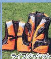
ライフジャケット