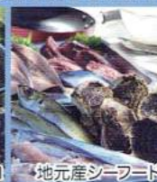
地元産シーフード

宿泊施設 … バンガロー A 棟・B 棟 (5人用/棟)、宿泊棟 A 室・B 室 (10人用/室)