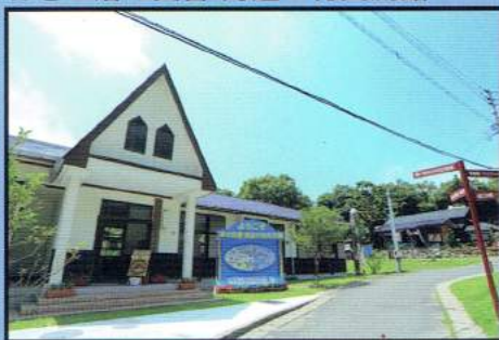
はざこ渚の交番 海辺の村交流館