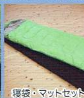
寝袋・マットセット