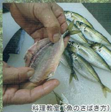
料理教室 (魚のさばき方)