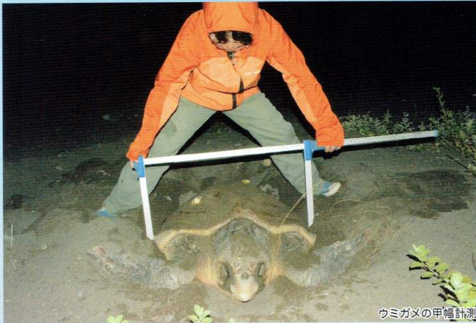
ウミガメの甲幅計測

間越を訪れる方々に、様々な体験型プログラムやウミガメレクチャーを通じて、自然を守り、自然と共存する方法を伝えています。