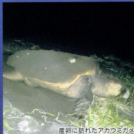
産卵に訪れたアカウミガメ

海に流れ込んだ栄養分豊富な水は、海藻類の栄養分となり、それらを食べる生き物たちをはぐくみます。