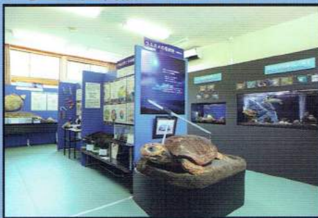
はざこ 人と自然のミュージアム