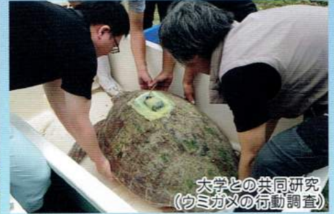
大学との共同研究 (ウミガメの行動調査)