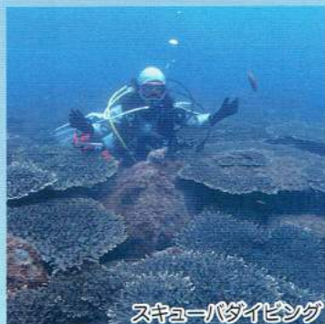
スキューバダイビング

間越海岸には、流入する河川が少なく、澄んだ美しい海にはサンゴ群生地もあり、ダイビングスポットとして人気です。