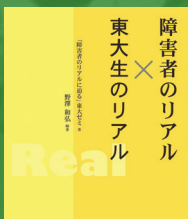
東大ゼミOB,OG [障がい者のリアルに迫るゼミ]