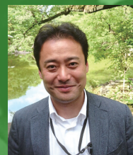
野崎 伸一 [厚生労働省 政策企画官]