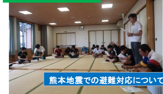
熊本地震での避難対応について(体験談)