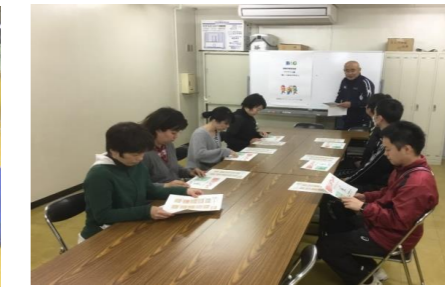
関係者と！ 富山県氷見市 海洋センター関係者で避難所開設マニュアルを確認