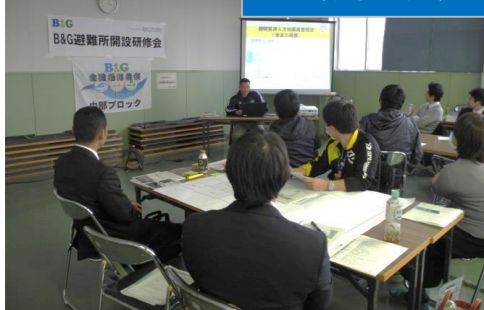
静岡県牧之原市職員による事例紹介