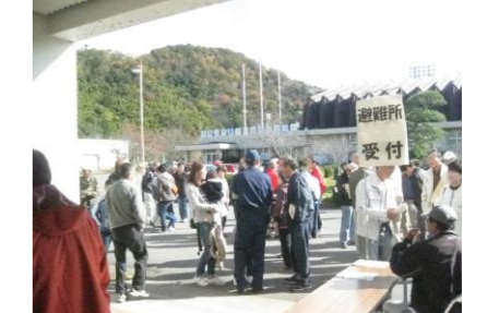
地域住民と！ 兵庫県篠山市 地域住民を集めた大規模な避難所開設訓練を実施