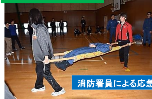
消防署員による応急担架体