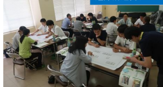
避難所運営ゲームで初動体制を確認