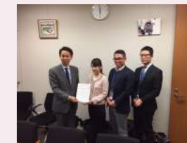
自殺総合対策大綱に関する要望書を提出