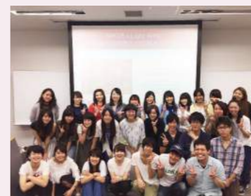
東京成徳大学での講演の様子

自殺やうつのリスクがある若者は全国にいます。私たちは各市区町村別の自殺実態分析や地域の実情に基づき、セルフケアや身近な支え手育成研修も1日単位で行わせていただいています。2017年度は18回、2011名に研修・講演をさせていただきました。