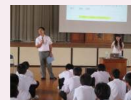
岩手県立黒沢尻工業高等学校