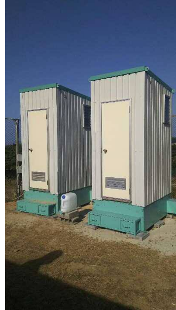
設置したバイオトイレ