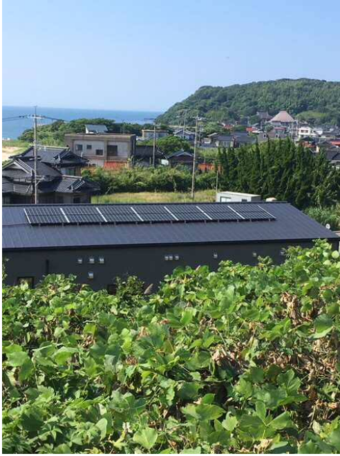
設置した太陽光発電設備