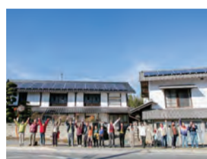
NPO 法人 上田市民エネルギー

侍学園(通称:サムガク)とは、社会において自立した生活をおくりに困難を有する子ども、若者たちが、自分らしく充実した人生が送れるように後押しする民間の教育施設です。誰かに与えられる教育ではなく、自ら探し、求め、スタッフと共に成長できる「共育」を活動理念としています。