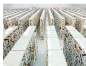
株式会社 バリューブックス

屋根や土地をみんなでシェアする市民発電所「相乗りくん」で自然エネルギーを増やしています。これまでに38カ所に441.37kWの太陽光パネルを設置、上田を始め全国のみなさんからの出資はもうすぐ1億円に達します。「わたしたちの未来はわたしたちが創る」、アクションを伴った市民力や地域力が未来づくりのカギだと考えています。