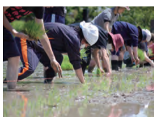
認定NPO 法人 侍学園 スクオーラ・今人

「犀の角(さいのつ)」は、上田市の中心地・海野町商店街の一角にあり、<劇場>と<ゲストハウス>からなる民間の複合文化施設です。地域住民、アーティスト、旅行者が、演劇や音楽、アート作品やイベントなどを楽しみながら相互交流することにより、この場から新しい価値観が創られていくことを願い活動しています。