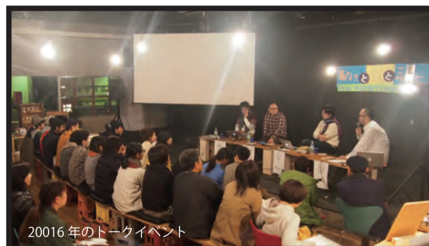
2016年のトークイベント

個性や自己決定、そして日々の「何気ない自由」について、リベルテは障害のある人たちとともに取り組むことを目指し2013年に設立。「何気ない自由」や「権利」を尊重していける社会や人、関係づくりを行っている。街の居場所や表現の場として障害福祉と文化活動を地域の中で試行している。