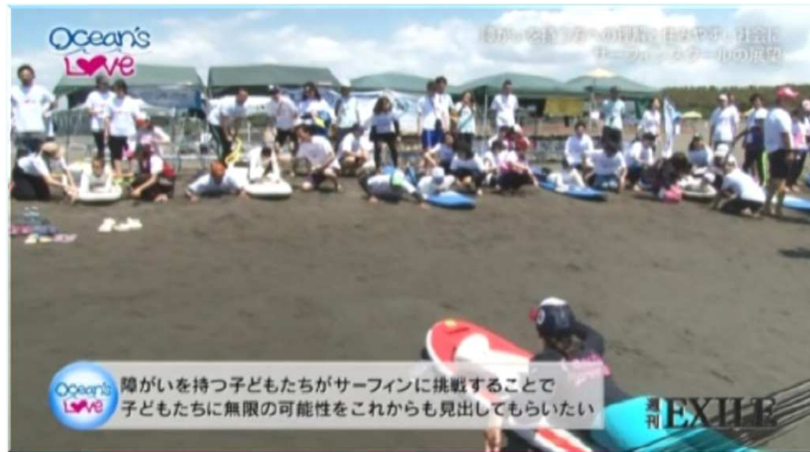
2018/06/18 TBS 「週刊EXILE」