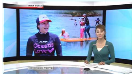
2018/07/25 NHK WORLD