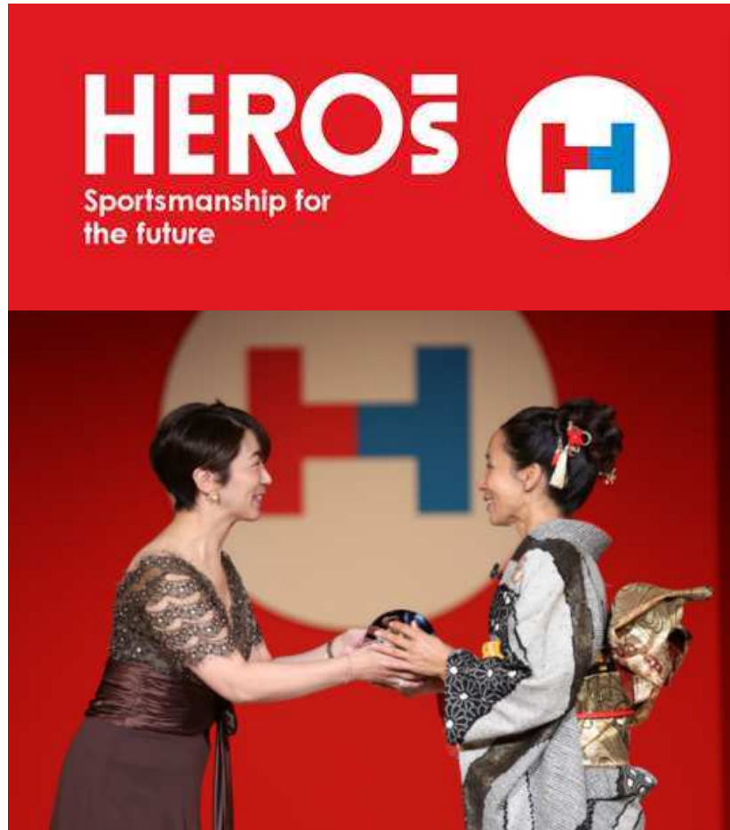
日本財団主催 HEROs AWARD2017受賞