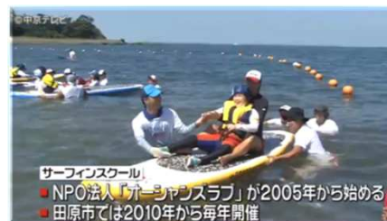
サーフィンスクール ● NPO法人「オーシャンラブ」が2005年から始める ● 田原市では2010年から毎年開催