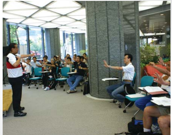
日本レクリエーション協会東先生による アイスブレイキングの講義。 簡単なゲームですが皆さん真剣です。