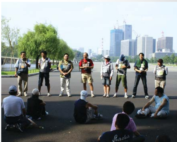
最後はこの日1日リーダー役を担った受講者の感想を 発表。こうして経験を積んでいくことが 実際の活動で生きてくるんですね。

新たに、約200名の ボランティアリーダーが 仲間入りします。 みんなで協力して スポーツイベントを 盛り上げていきましょう!