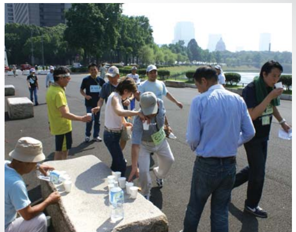
給水の実習も行ないました。 上手に渡すのはなかなか難しい?!