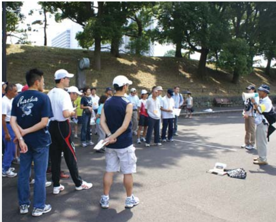
午後は皇居にてマラソンを題材にした実習。 暑い中みなさん積極的にかんばりました。

7月より全5回で2008年のボランティアリーダー養成研修を行いました。笹川スポーツ財団では2006年よりスポーツボランティアをとりまとめるリーダーの育成を開始し、現在登録者が700名を超えました。東京マラソンや湘南オープンウォータースイミングなどでのボランティアをきっかけに、今までの経験を生かしたたくさんの方に受講いただきました。今年も約200名が新たにボランティアリーダーとして皆さまの仲間入りをしました。