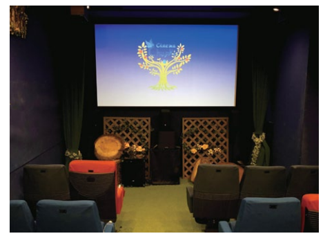
ユニバーサルシアターを訪れてみました 森をイメージしたシアター内部。木の装飾の一部は吸音材の役割も果たしている（写真はすべて2018年に撮影）

「障害の有無にかかわらず、映像文化をさまざまな人と共有したい」。そんな思いから筆者は昨年11月にみんぱく映画会「映画が拓く新たなバリアフリーの世界」を実施した。上映会に先立ち、筆者は日本で唯一のユニバーサルシアター「シネマ・チュプキ・タバタ（CINEMA Chupki TABATA）」に足を運ぶことにした。