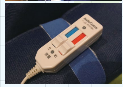
上：映画の音を震動で感じられる「抱っこスピーカー」を希望者に貸し出している 下：全席に搭載されたイヤホンジャックには、左右の音のボリュームを調節できるレバーがある