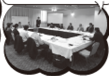
徒弟制度受講者相互勉強会