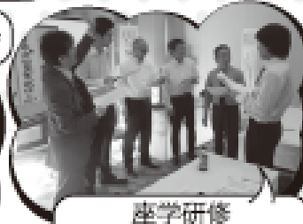
座学研修 (危険予知訓練の様子)

このようなプログラムで、 全国から24名の 造船マンが参画し、 技量を高め合っ ています！