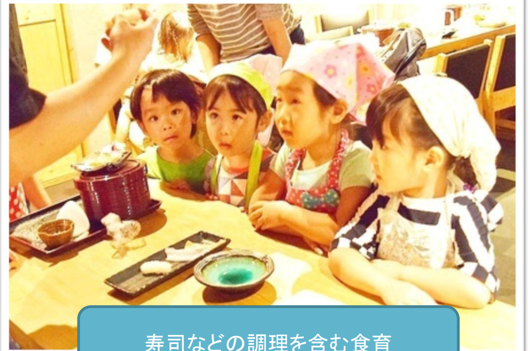
寿司などの調理を含む食育