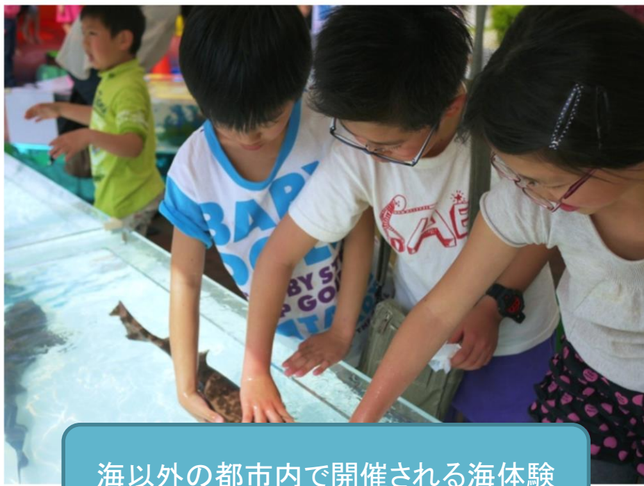
海以外の都市内で開催される海体験