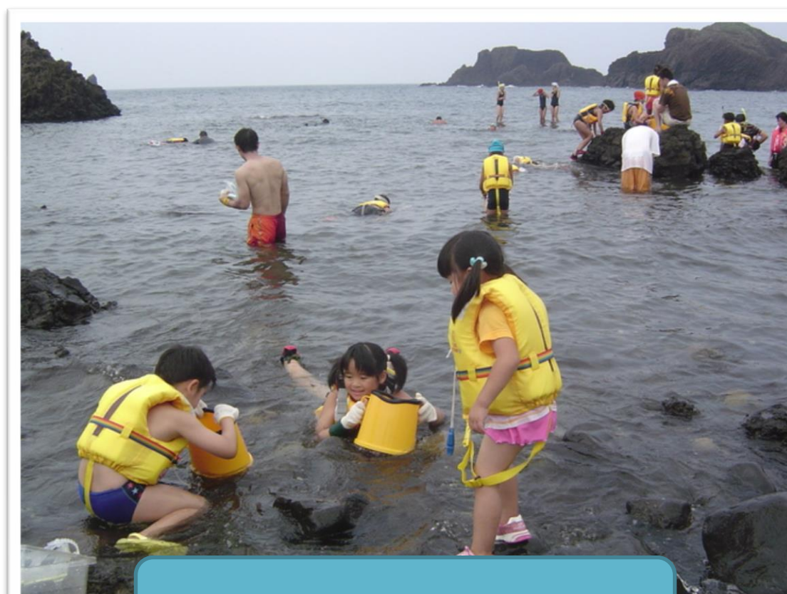
海で開催される海体験