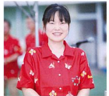
式典 司会 競技進行アナウンス