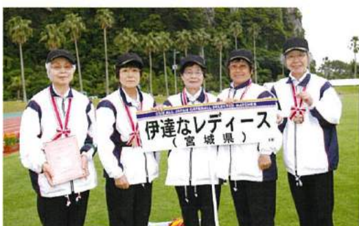
第3位：伊達なレディース（宮城県）