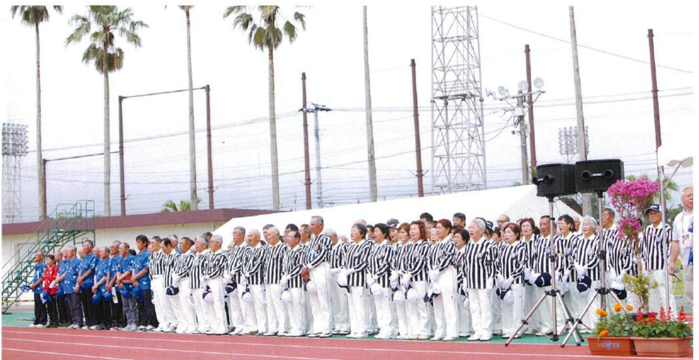
鹿児島県ゲートボール協会 大会役員