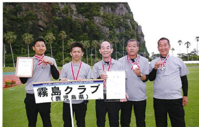
準優勝：霧島クラブ（鹿児島県）