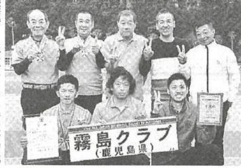
準優勝した霧島クラブの選手ら 一指宿市営陸上競技場

第33回全国選抜ゲートボール大会最終日は20日、指宿市営陸上競技場で男女の予選リーグ残り2試合と決勝トーナメントがあり、男子は水都(岐阜)、女子は木曜クラブ(岩手)が優勝した。鹿児島県勢では、男子の霧島クラブが準優勝した。