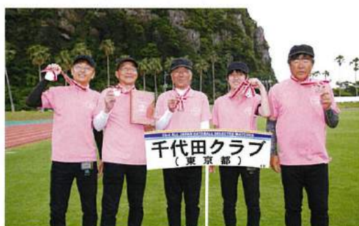
第3位 千代田クラブ（東京都）