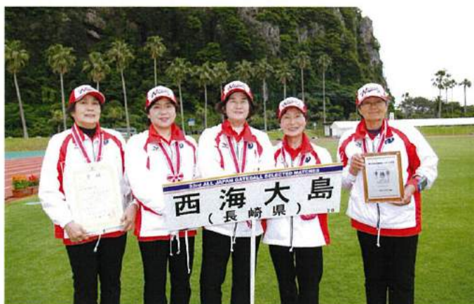
準優勝：西海大島（長崎県）