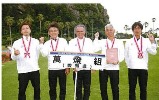
第3位：萬燈組（愛知県）