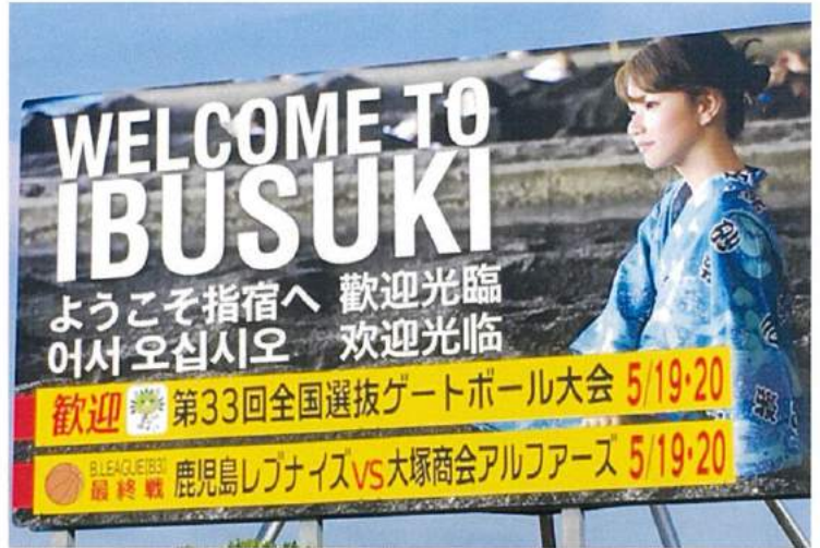
道の駅「いぶすき」交差点に設置された告知看板