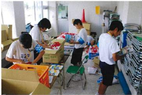
北指宿中学校の校外学習（参加記念品袋詰め）