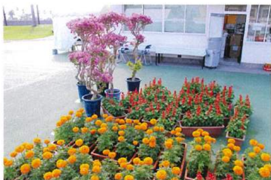
会場を彩った花の数々