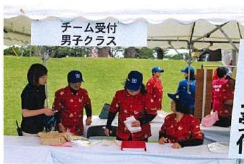
指宿市 婦人会の方々