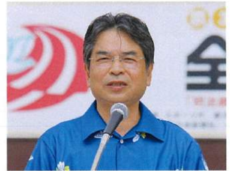
指宿市長 豊留 悦男 様