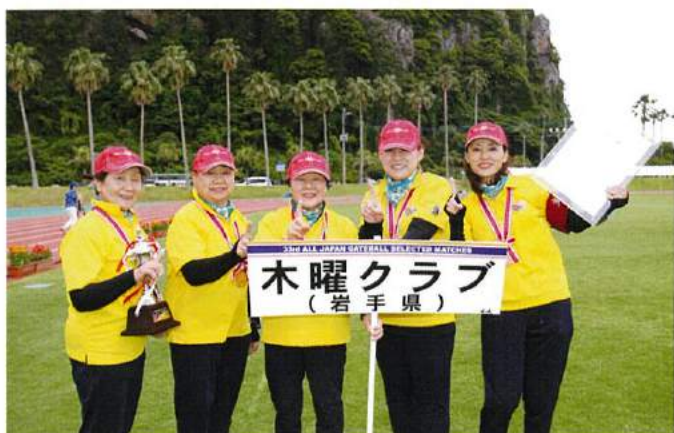
優勝：木曜クラブ（岩手県）