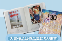
入賞作品は作品集になります

【海と日本PROJECTエリア賞】 最優秀エリア賞 ポスター部門 表彰状・表彰盾・作品集・副賞10万円 最優秀エリア賞 動くポスター(動画)部門 表彰状・表彰盾・作品集・副賞10万円 エリア賞 表彰状・作品集