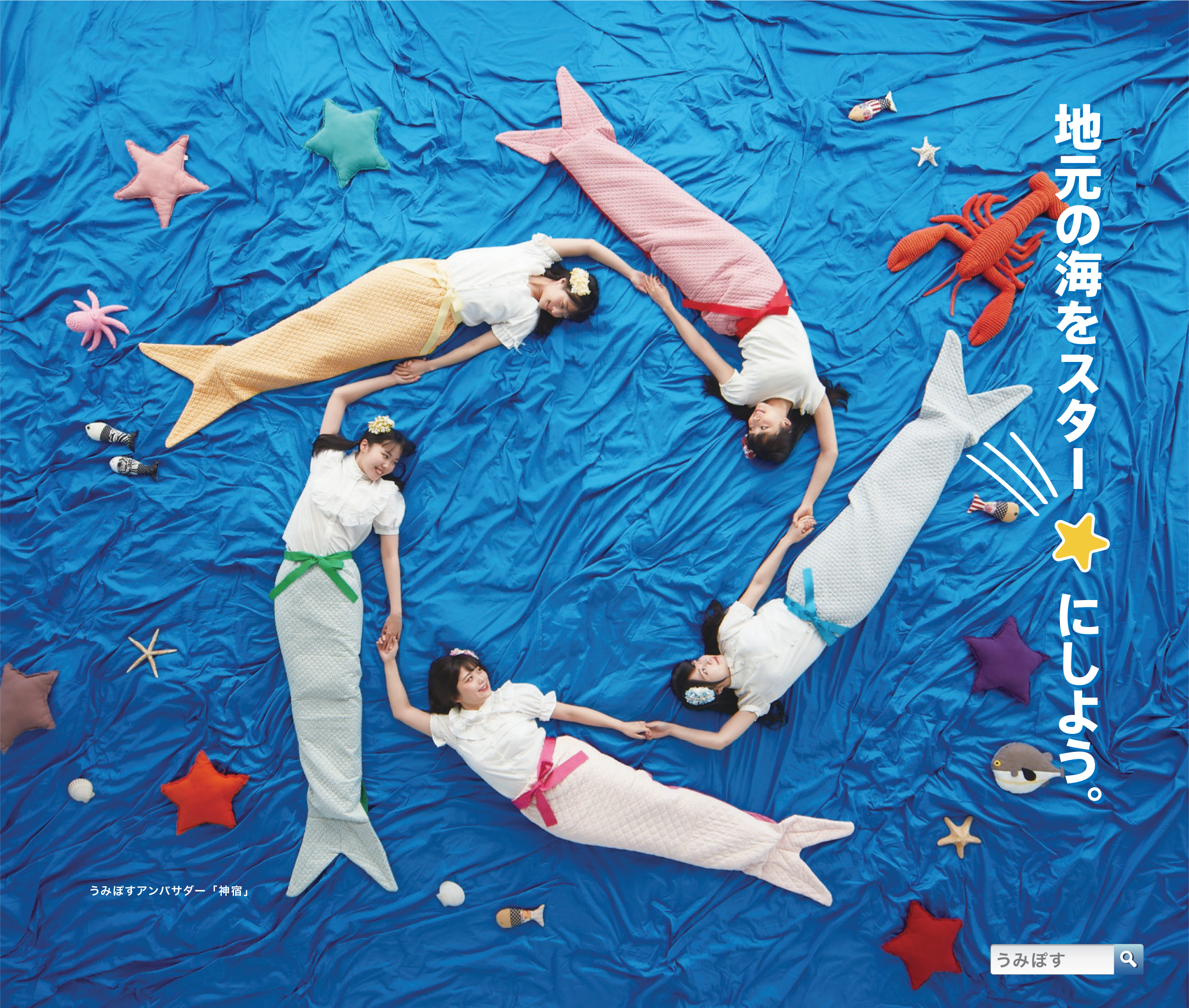
うみぼすアンバサダー「神宿」