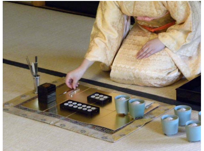
2種類の香を聞き、香りを覚えてから、最後に3種類の香を聞きます。