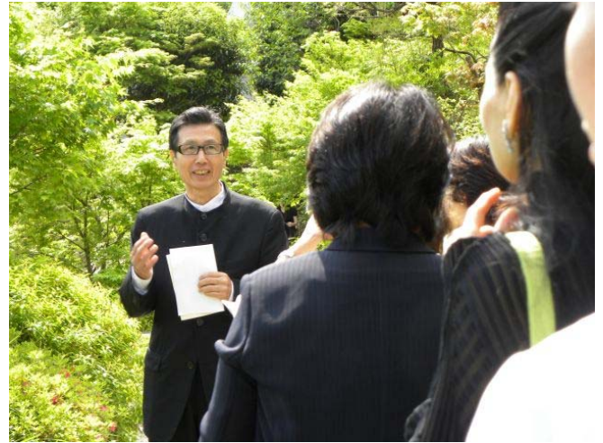
まずは、目白庭園内を散策。みなさまと一緒に春を感じました。