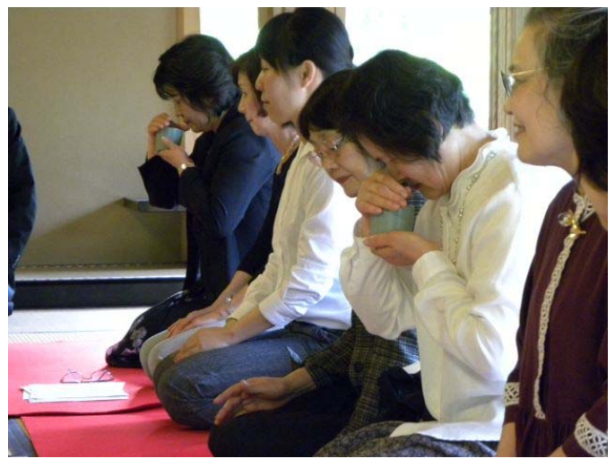
先生から分かりやすく説明があるので、みなさま初めての体験でしたが楽しんで頂けたようでした。