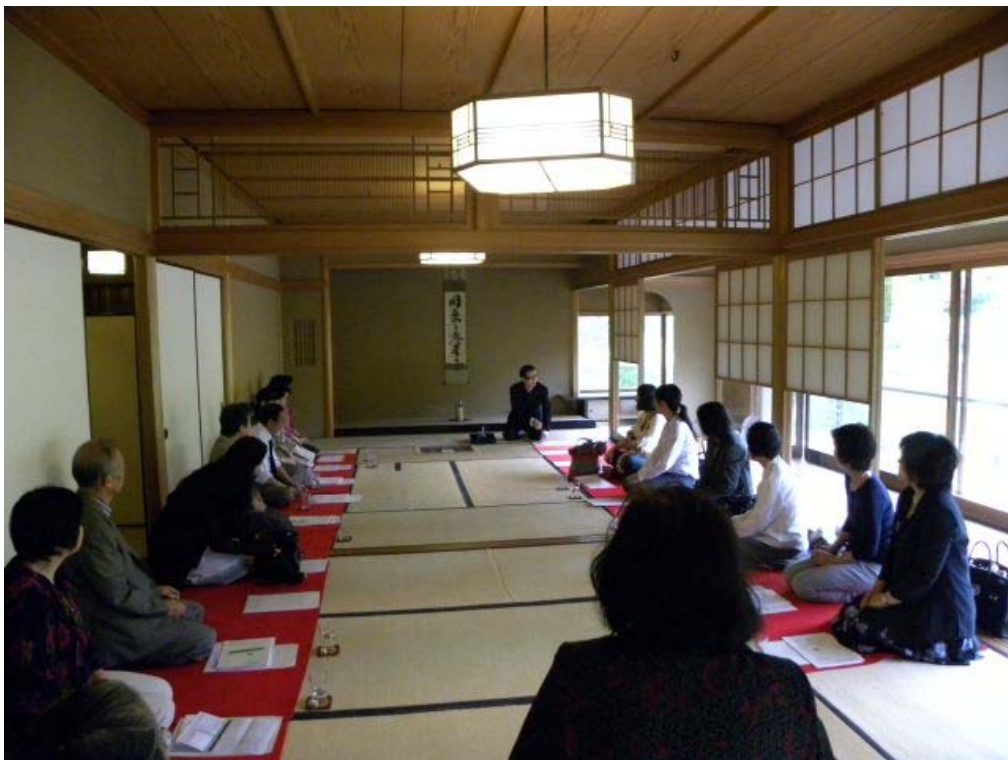
はじめに先生から本日のテーマについてのお話し