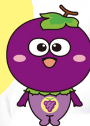
羽曳野市ご当地キャラクター つぶたん