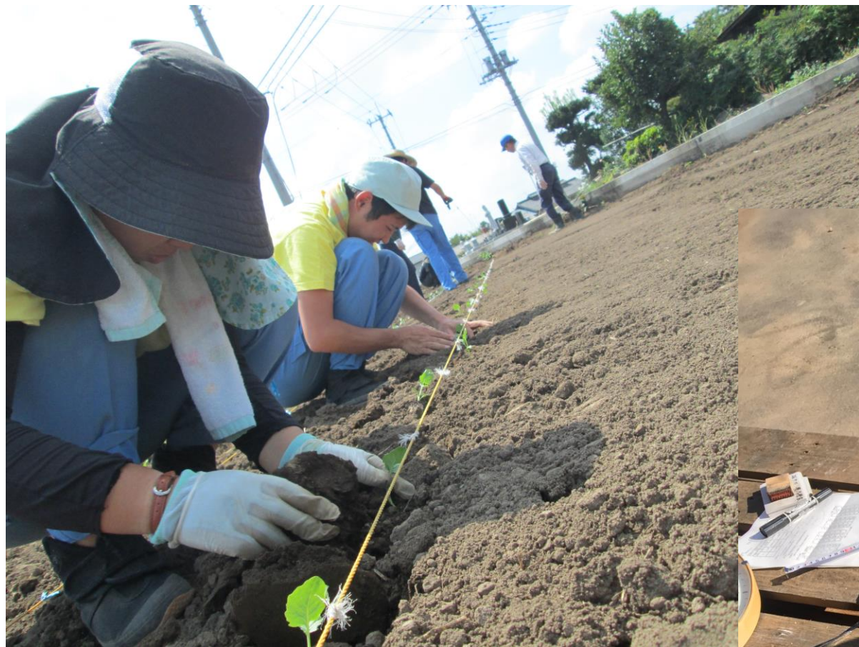
ブロッコリー一定植作業