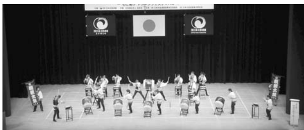
(桐親会和太鼓クラブ)

色々な舞台上で演奏し、経験を積んできました。まだまだ修行中ではありますが、今日も気持ちを合わせてうちます。さらに進化した「桐親太鼓」、どうぞお聞き下さい！