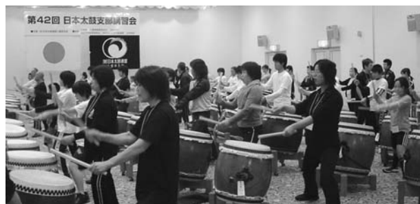
(5級基本講座の様子)

3級検定 9名受験 7名合格 4級検定 18名受験 18名合格 5級検定 61名受験 61名合格