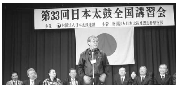
(開会式で挨拶をする古屋支部長)