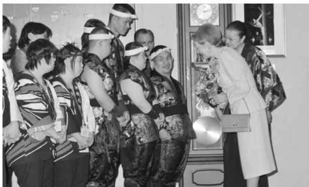
(出演者にお声をかけられる皇后陛下)

10月5日(日)、第10回日本太鼓全国障害者大会が、東京都の文京シビックホールにて開催されました。