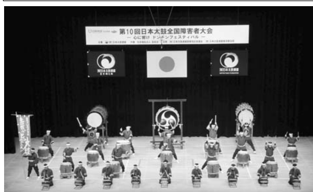
(公演の最後を飾る恵那のまつり太鼓)