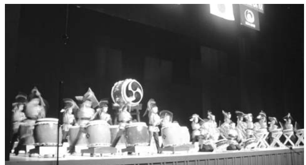
(台中・天祥太鼓の演奏)

紙面の都合上、台湾太鼓公演関連の記事は、引き続き次号(4月発行)で掲載させていただきます。