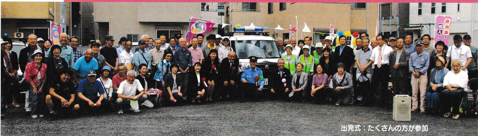
出発式・たくさんの方が参加