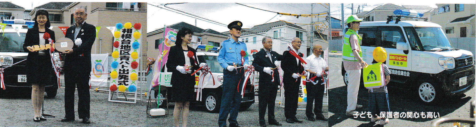
子ども、保護者の関心も高い

犯罪・交通事故の減少を願う地域の方々の協力で、私たちの青パトはほぼ毎日、地域を巡回しています!