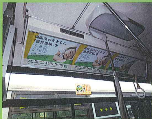
西鉄バス 車内広告