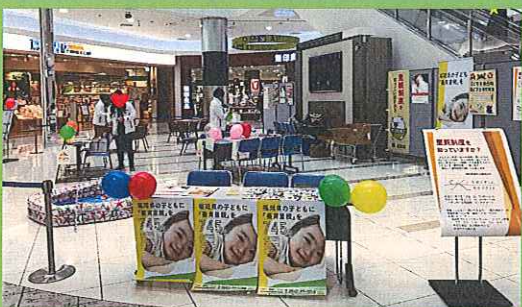
筑紫野イオンモールでのイベント