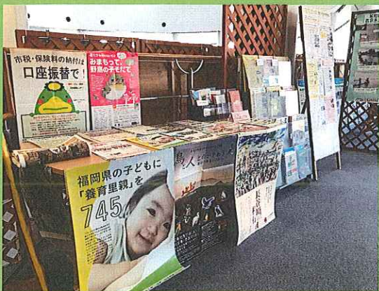
くるめウスでのポスター設置