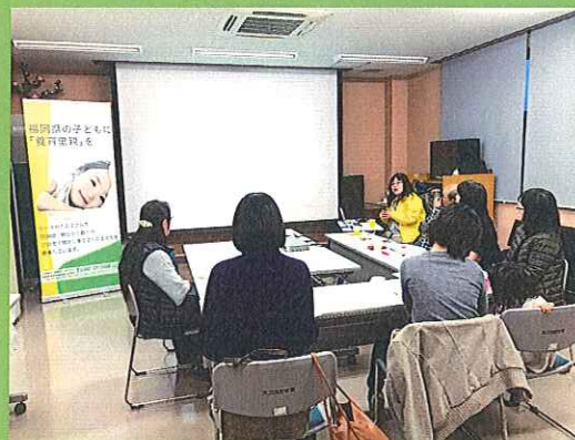
大刀洗町とのイベント