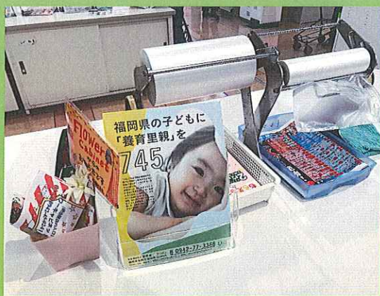
明治屋ジャンボでのチラシ設置