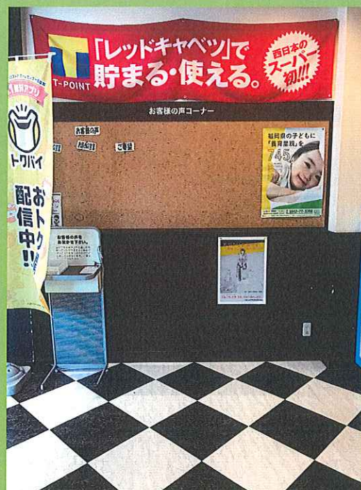
レッドキャベツ梅満店でのポスター