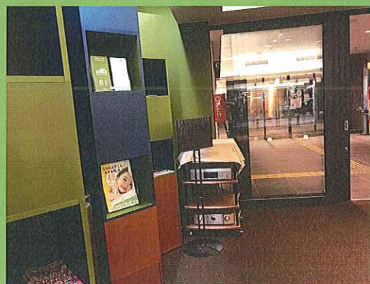
久留米シティプラザでのチラシ設置