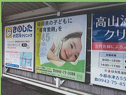
西鉄電車4駅に看板設置