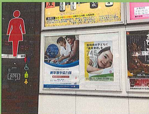
JR 久留米駅 ポスター掲示