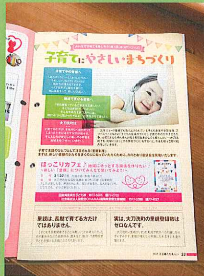
大刀洗町の広報誌