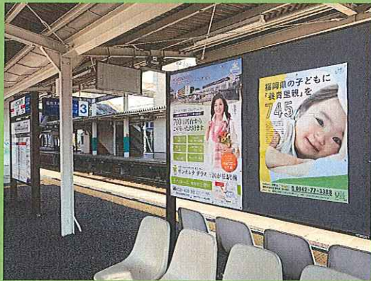
西鉄電車 駅構内にポスター掲示 ※写真は小郡駅