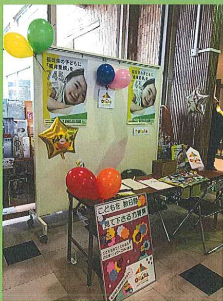
大川市福祉フェアでのイベント